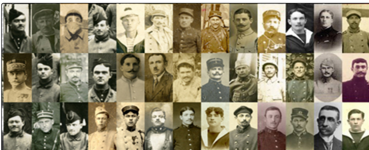
MORTS POUR LA FRANCE