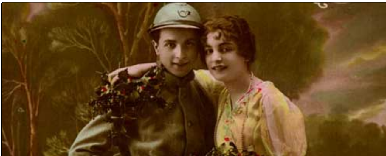
PREMIÈRE GUERRE MONDIALE