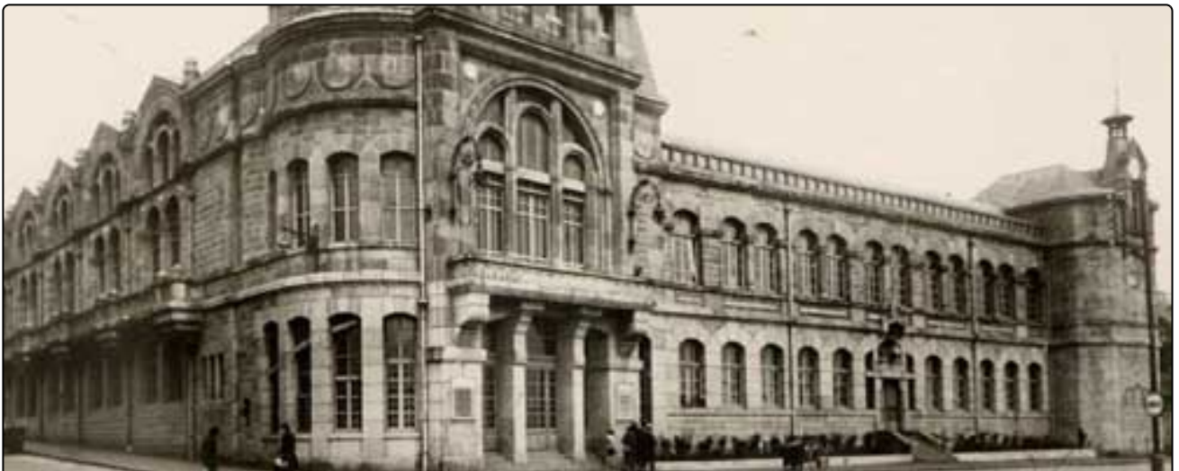
ETABLISSEMENTS CULTURELS ET DE LOISIRS