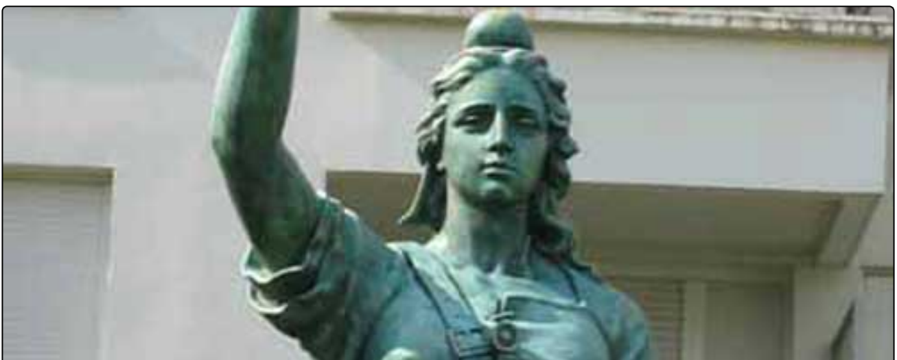
STATUES ET SCULPTURES