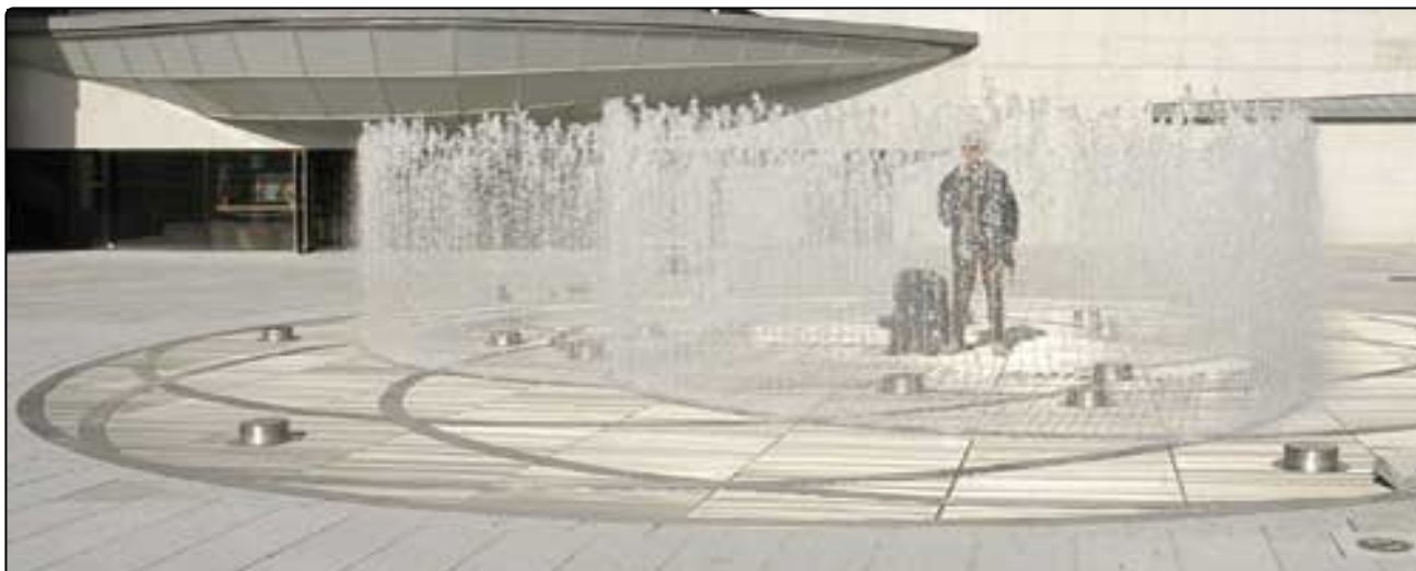
FONTAINES, LAVOIRS, RÉSERVOIR, AQUEDUC