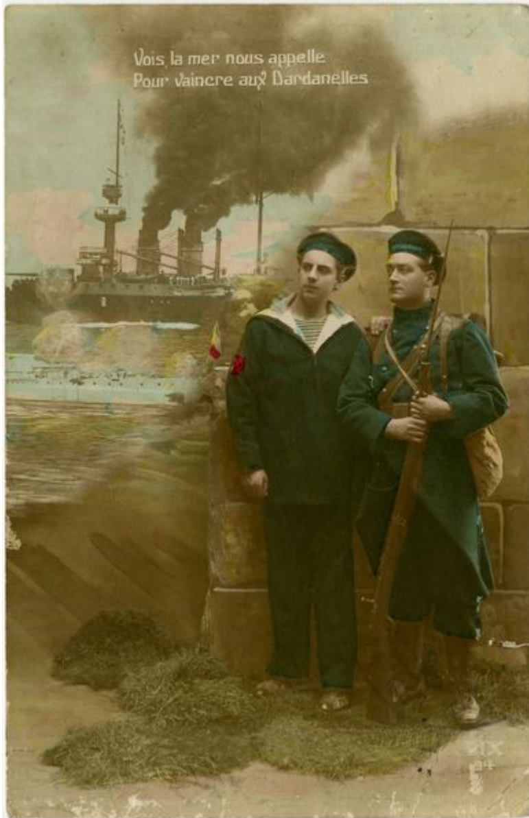
Vaincre aux Dardanelles, 1915

Le 14 octobre 1915 la Bulgarie entre en guerre contre la Serbie, la majorité des troupes alliées est alors évacuée de la presqu'île, le 9 janvier 1916 et transférées à Salonique en Grèce pour combattre le nouvel ennemi. Quelques soldats restent pour défendre les positions et masquer l'opération. 180 000 soldats meurent lors de la campagne, dont 30 000 Français. L'Australie et la Nouvelle-Zélande perdent le plus d'hommes dans cette campagne. Le 25 avril est un jour férié dans ces pays.