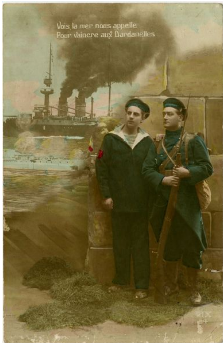
Vaincre aux Dardanelles, 1915

Le 14 octobre 1915 la Bulgarie entre en guerre contre la Serbie, la majorité des troupes alliées est alors évacuée de la presqu'île, le 9 janvier 1916 et transférées à Salonique en Grèce pour combattre le nouvel ennemi. Quelques soldats restent pour défendre les positions et masquer l'opération. 180 000 soldats meurent lors de la campagne, dont 30 000 Français. L'Australie et la Nouvelle-Zélande perdent le plus d'hommes dans cette campagne. Le 25 avril est un jour férié dans ces pays.