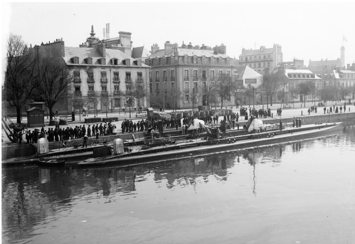
Sous-marins dans le bassin à flot

La Première Guerre mondiale est le premier conflit où les sous-marins ont un réel impact. En 1914, les Anglais et les Français entreprennent un blocus maritime de l'Autriche-Hongrie et de l'Allemagne. Cette dernière riposte en 1915 et engage deux ans plus tard une guerre sous-marine totale. Les U-Boote coulent les bâtiments militaires et marchands, de tous pays et sans avertissements. Pour l'Allemagne c'est petit à petit le seul recours pour terminer la guerre victorieusement. A partir de cet instant, les navires marchands alliés naviguent en groupes ou en convois. Ils sont escortés par des navires de guerre et appuyés par les forces aériennes lorsqu'ils sont près des côtes.