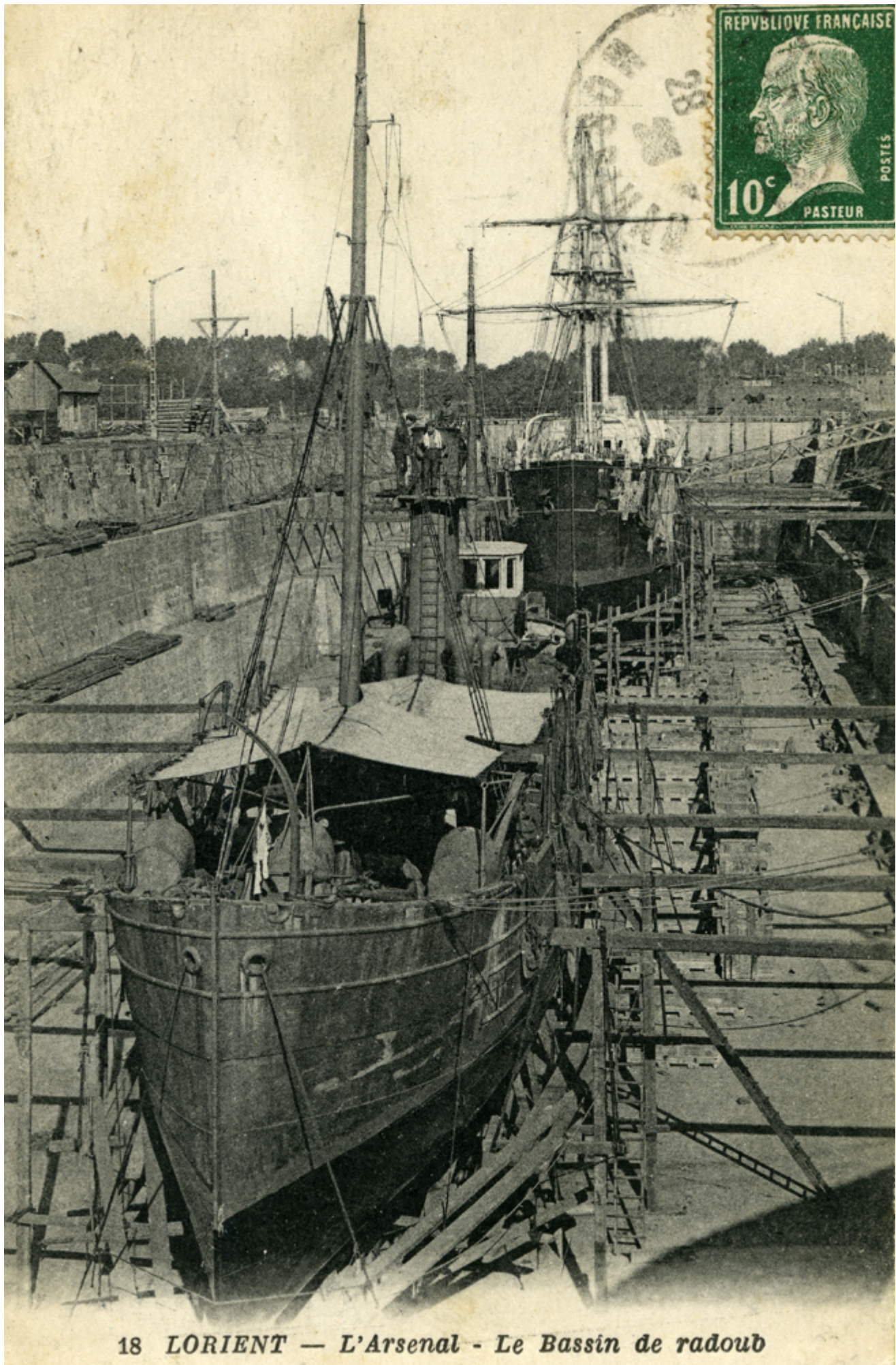
18 LORIENT — L'Arsenal - Le Bassin de radoub