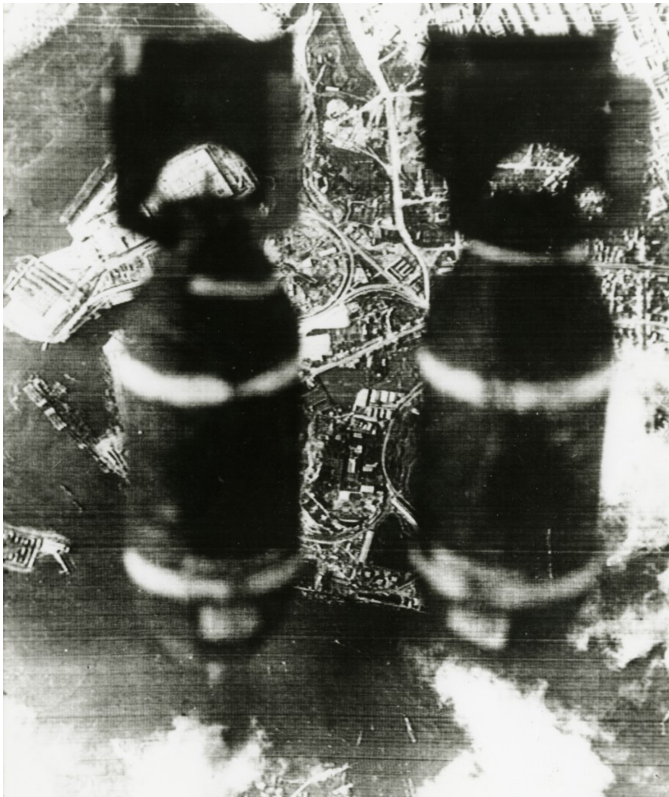
Bombes alliées (5Fi211)