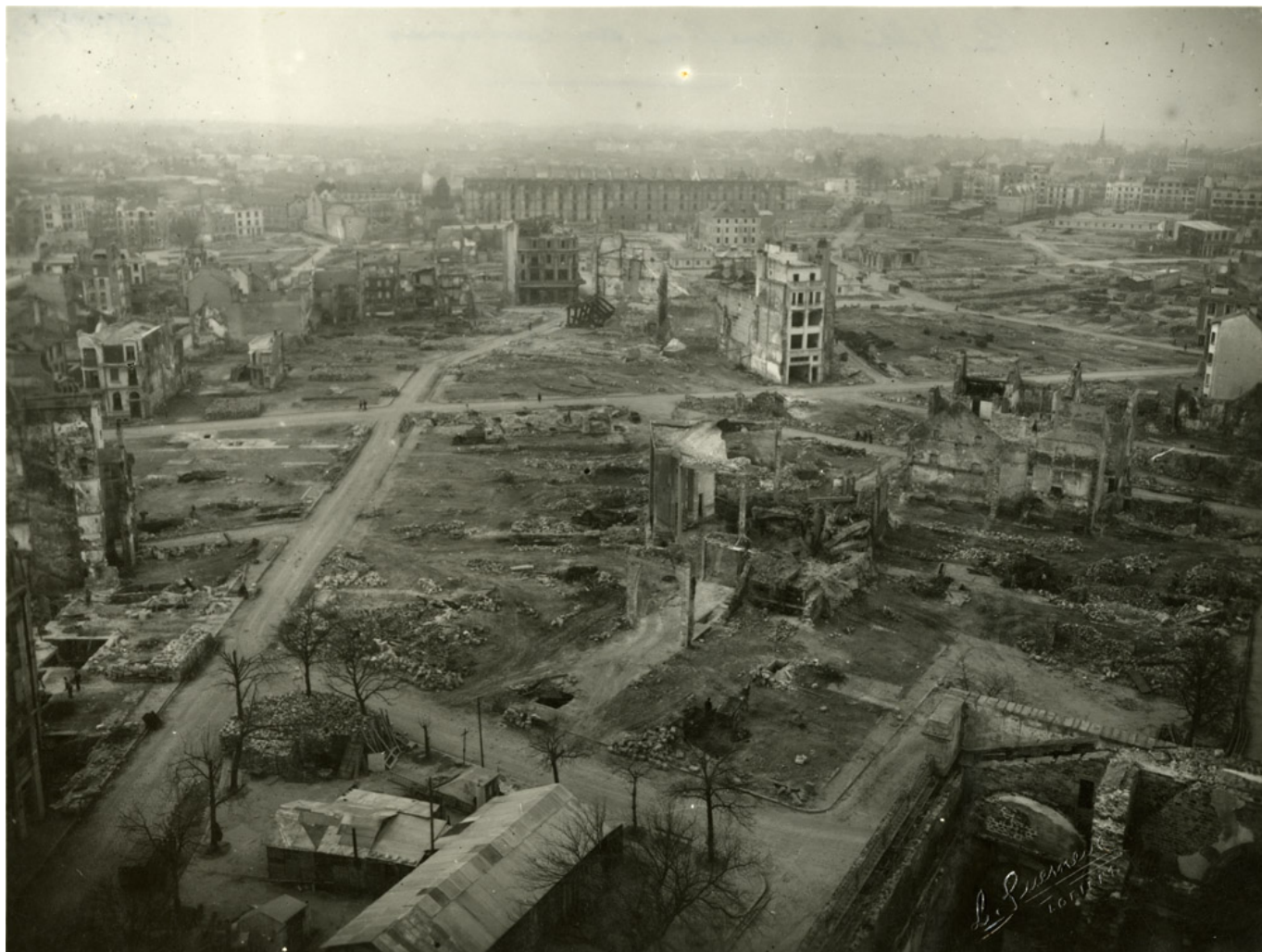
Panorama de la ville détruite (5Fi196)

120 maisons, dont deux églises, étaient détruites par le feu ou par explosions. On comptait 12 tués et plusieurs blessés. L'émotion causée par cette agression n'était pas calmée lorsque, le même jour, à 19h30, une nouvelle attaque se produisit, avec une violence accrue. Le bombardement se poursuivit pendant deux heures, sans interruption. On peut considérer que le nombre d'avions assaillants était de 200.