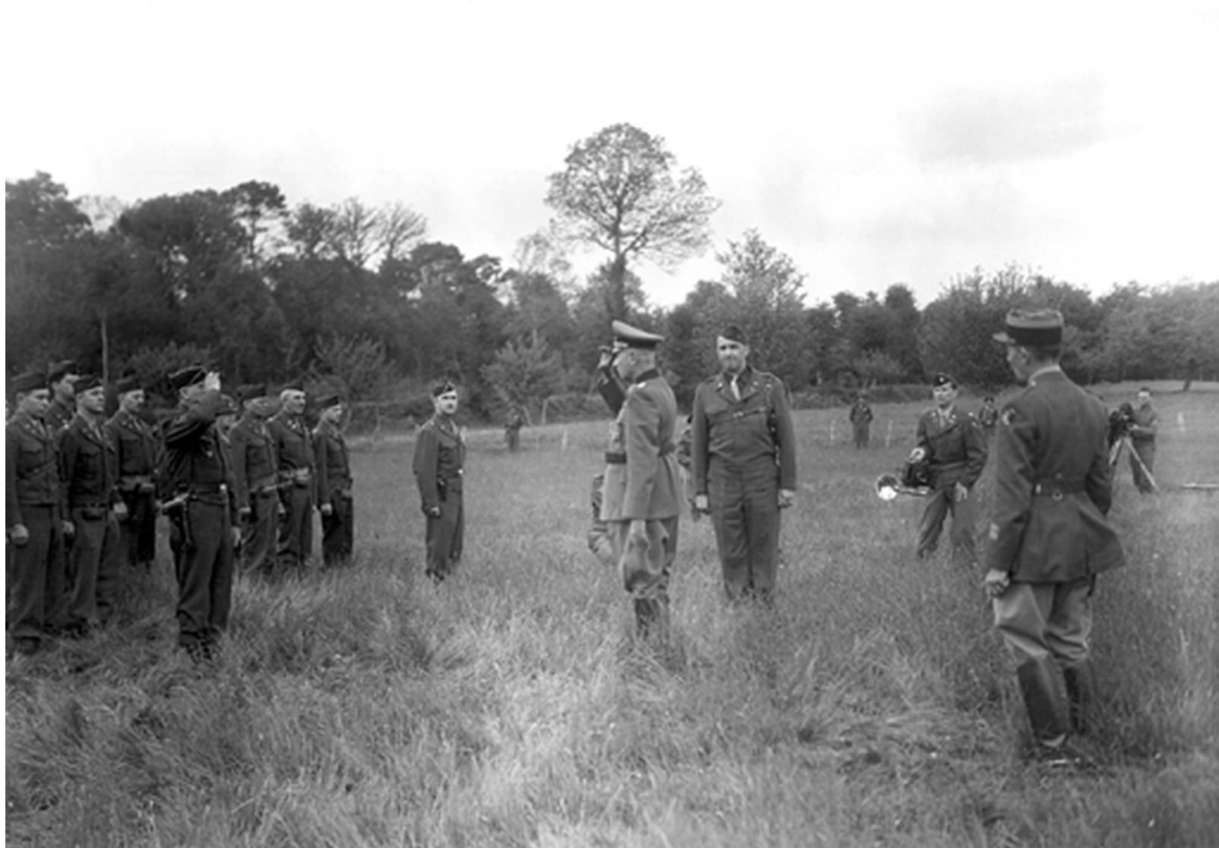
Cérémonie de la reddition à Caudan