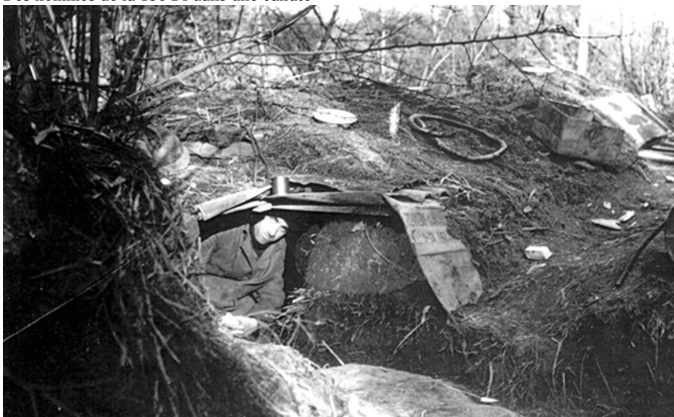
Une cahute entre Gestel et Pont-Scorff