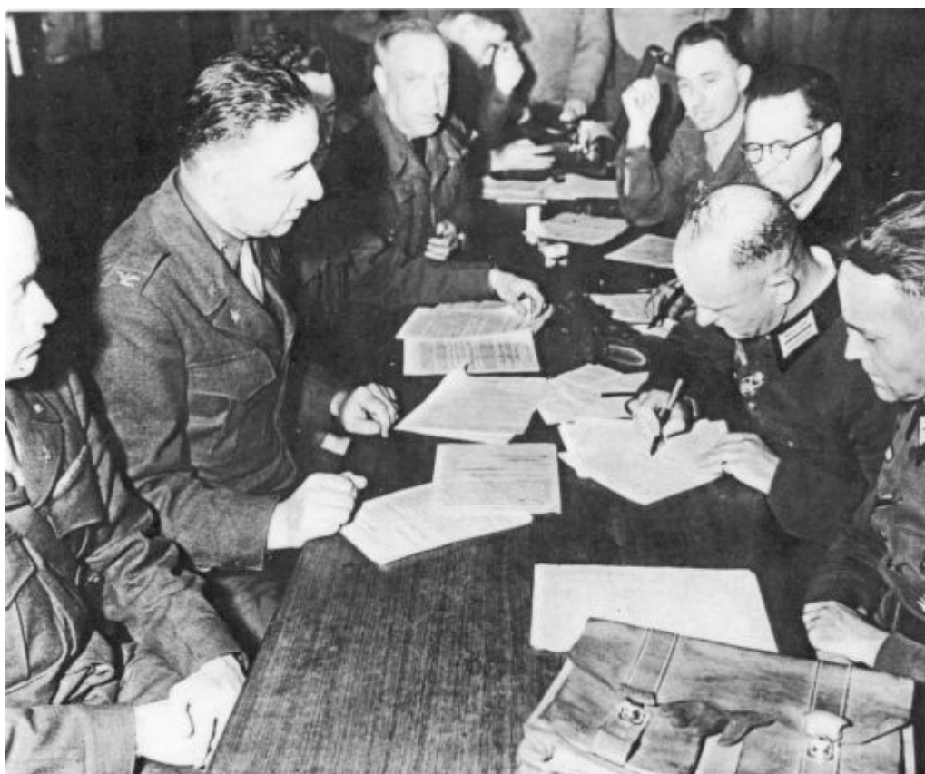
La signature de la reddition

La Citadelle de Port-Louis fut également un lieu de répression et de supplice pour les Résistants captifs. Après la reddition allemande, un charnier y fut découvert en mai 1945. 69 patriotes avaient été jetés vivants dans la fosse avant d'être mitraillés. Le Mémorial a été conçu en 1959 en leur mémoire.