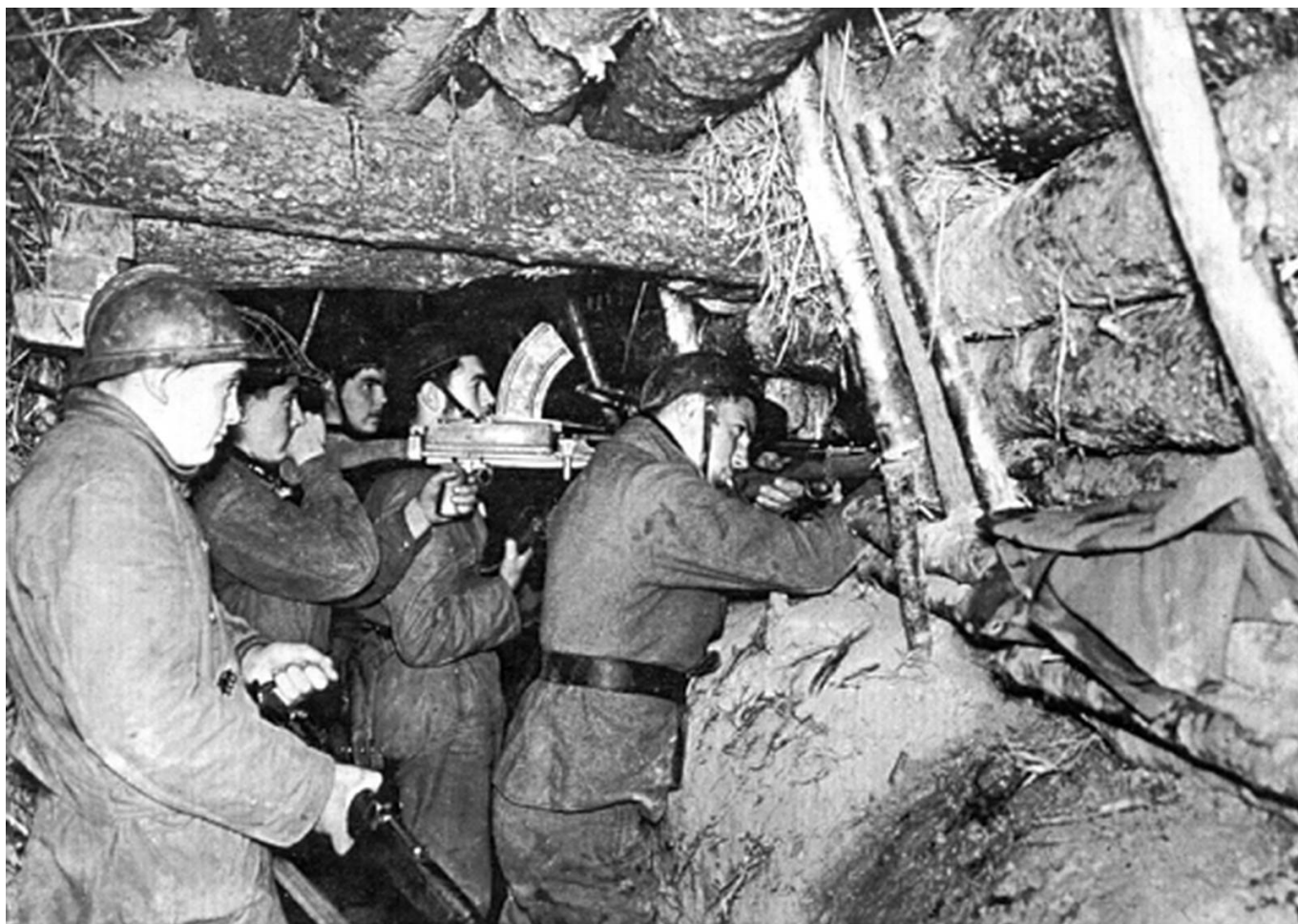
Des hommes de la 19e DI dans une cahute