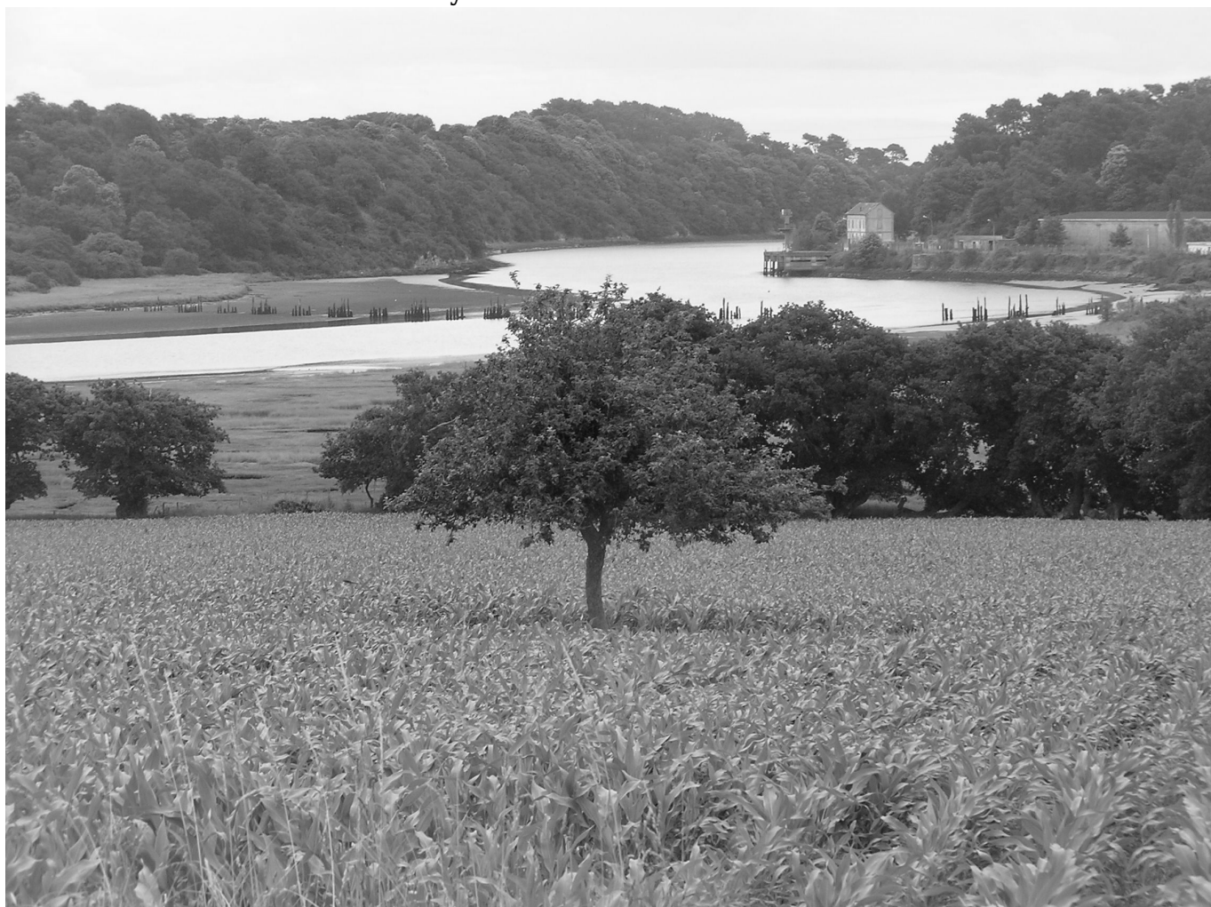
Vestiges du Pont-Brûlé à Quéven