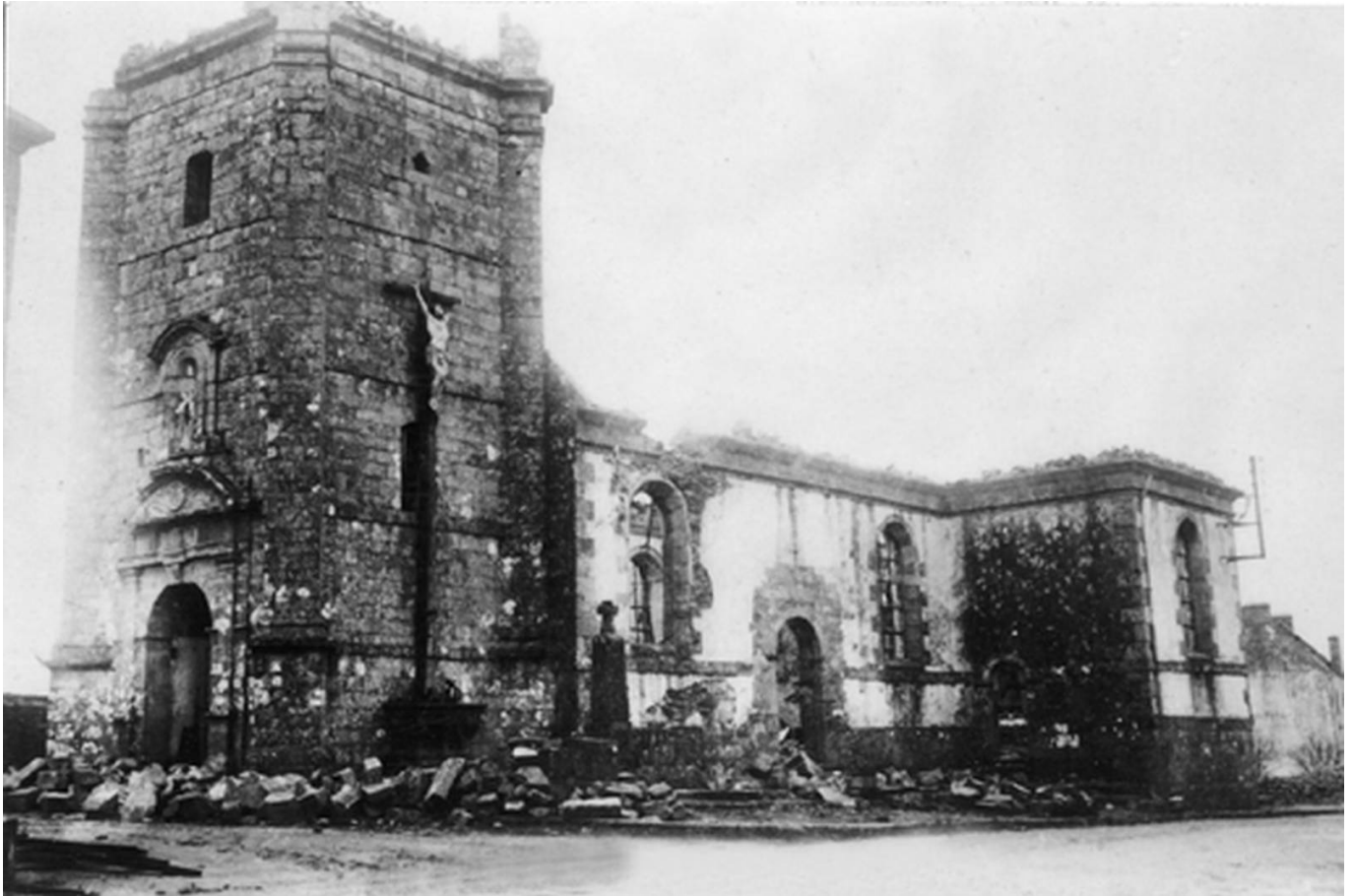
L'église de Sainte-Hélène en 1945