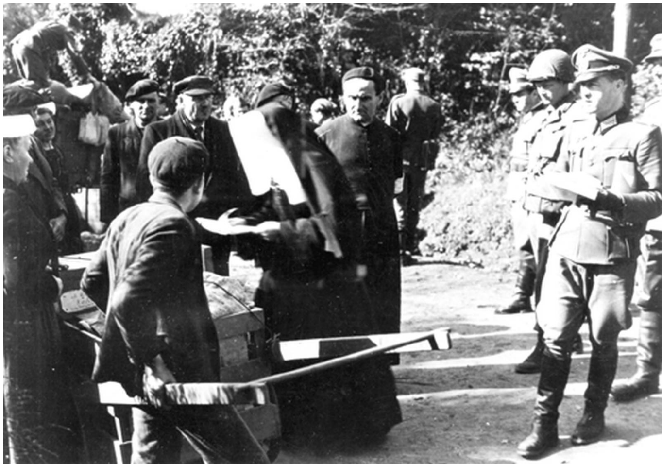
Evacuation de la Poche - Guidel