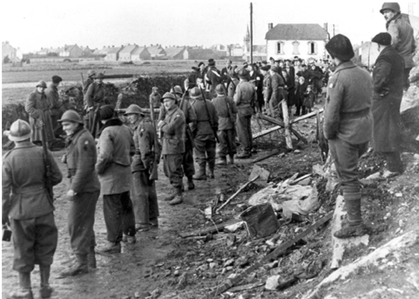
Evacuation de la Poche - Plouharnel