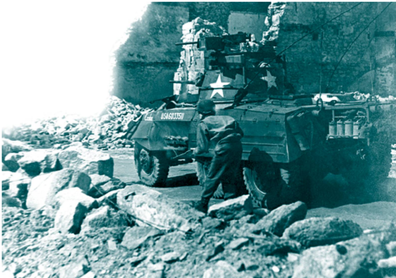
Fantassin américain progressant à l'abri d'un blindé à Hennebont