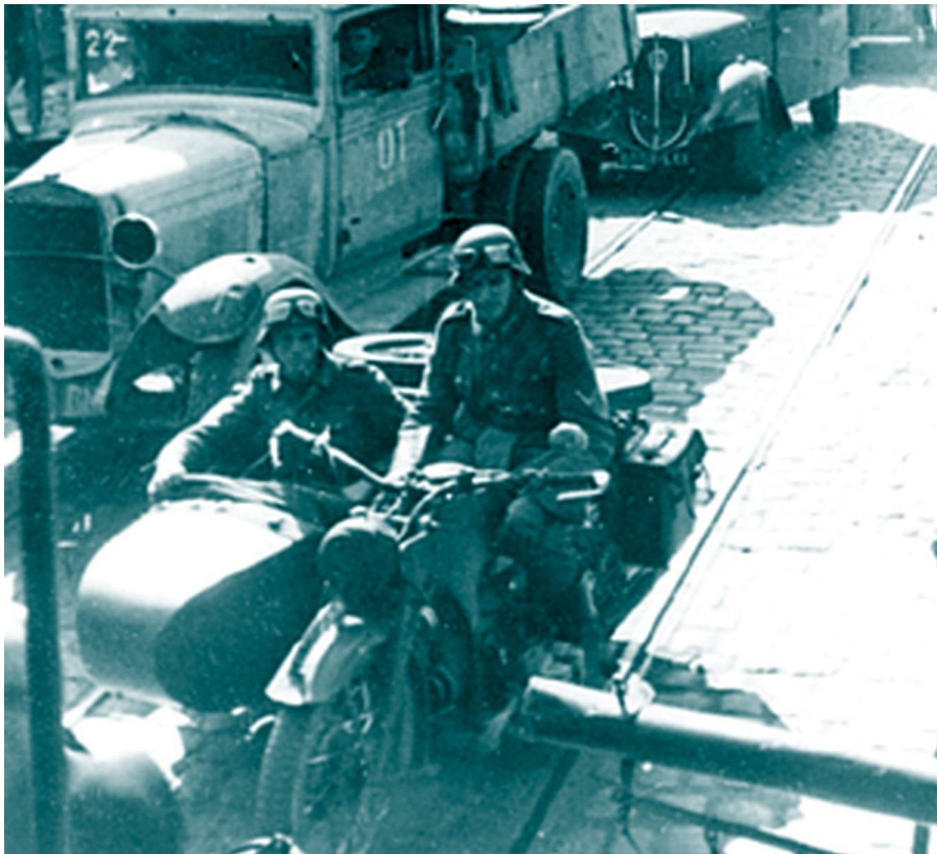
Allemands en side-car cours de Chazelles à Lorient