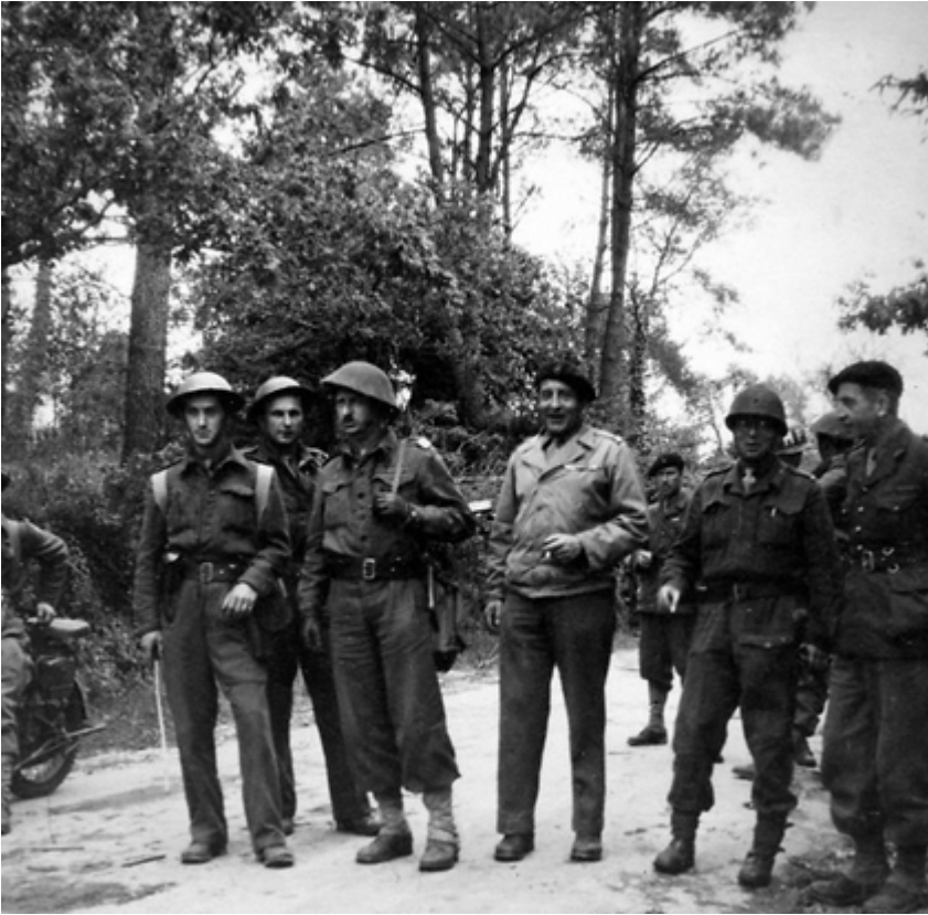
Soldats du front de Lorient