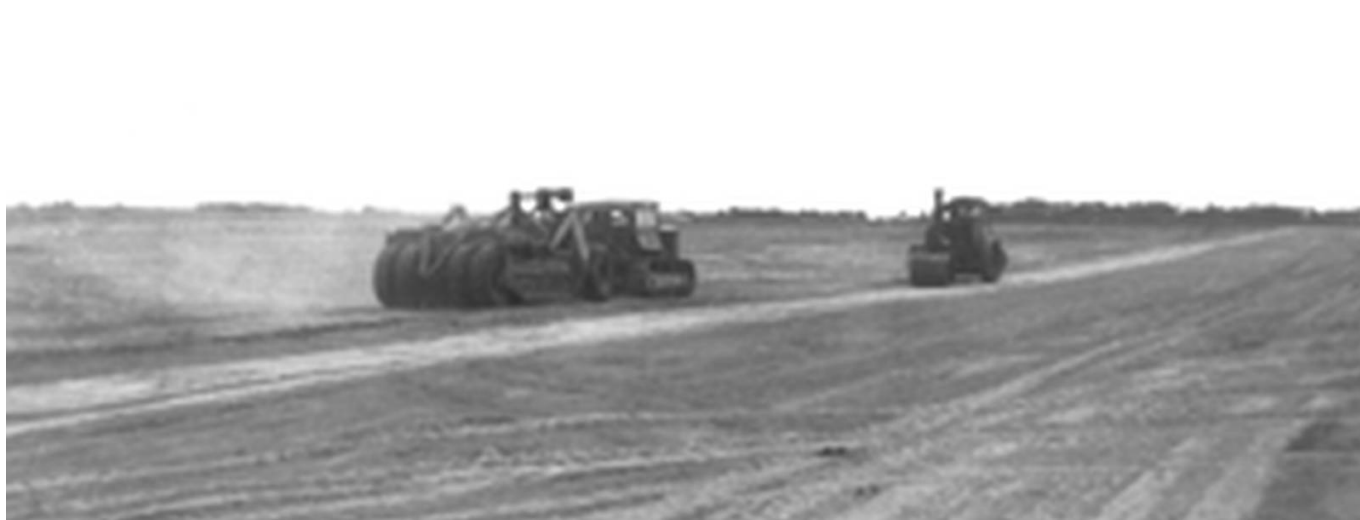
Construction des pistes à Kerlin-Bastard

La base aéro-navale de Lann-Bihoué en 1941 :