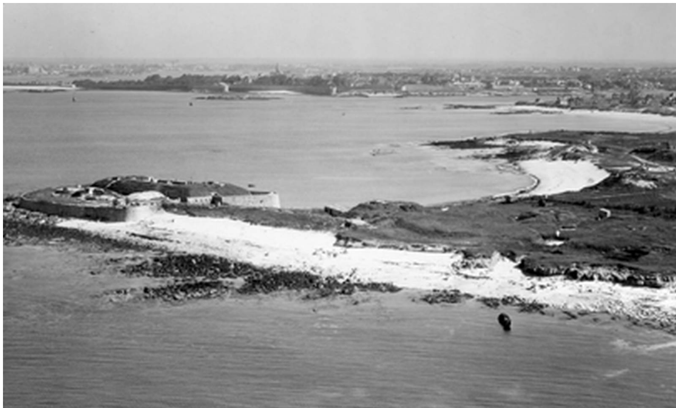
Porh-Puns à la pointe de Gâvres