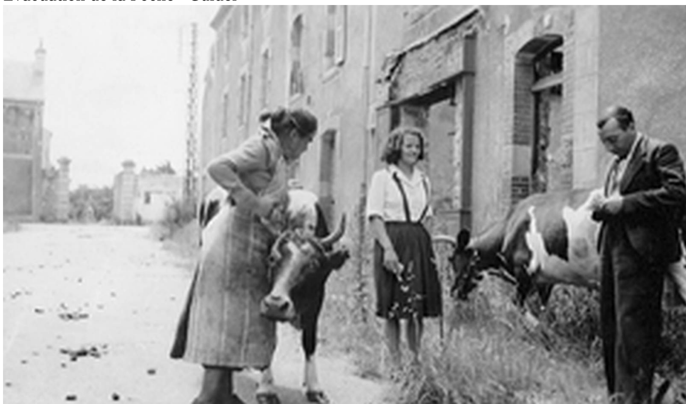
Vache broutant rue de Strasbourg - Lorient