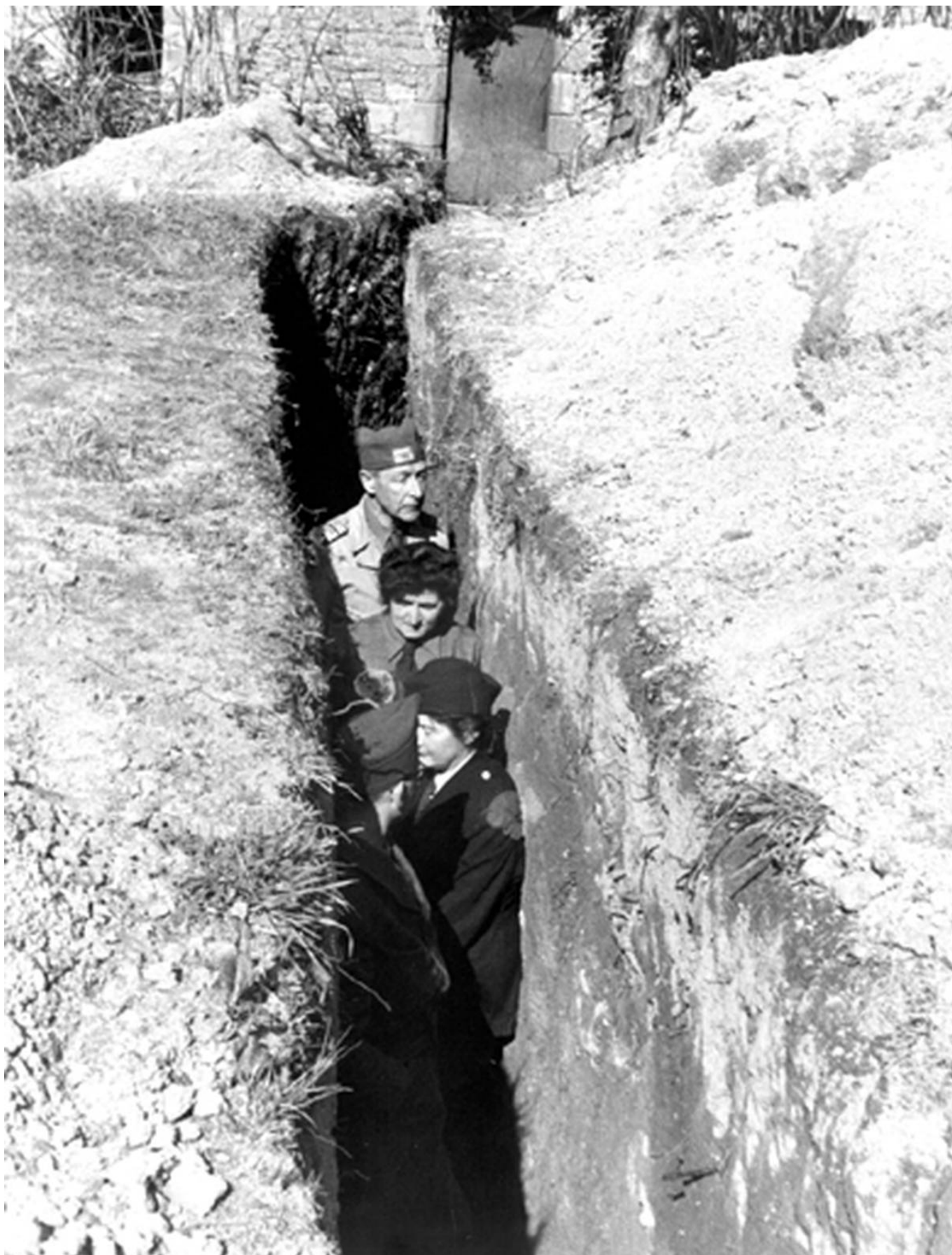
Un abri à Plouharnel