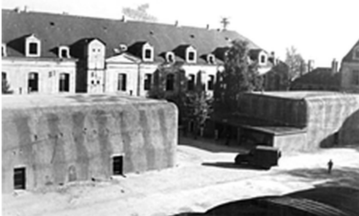
Blockhaus dans l'arsenal de Lorient