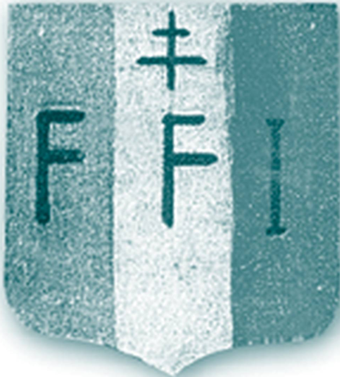
Macaron des FFI