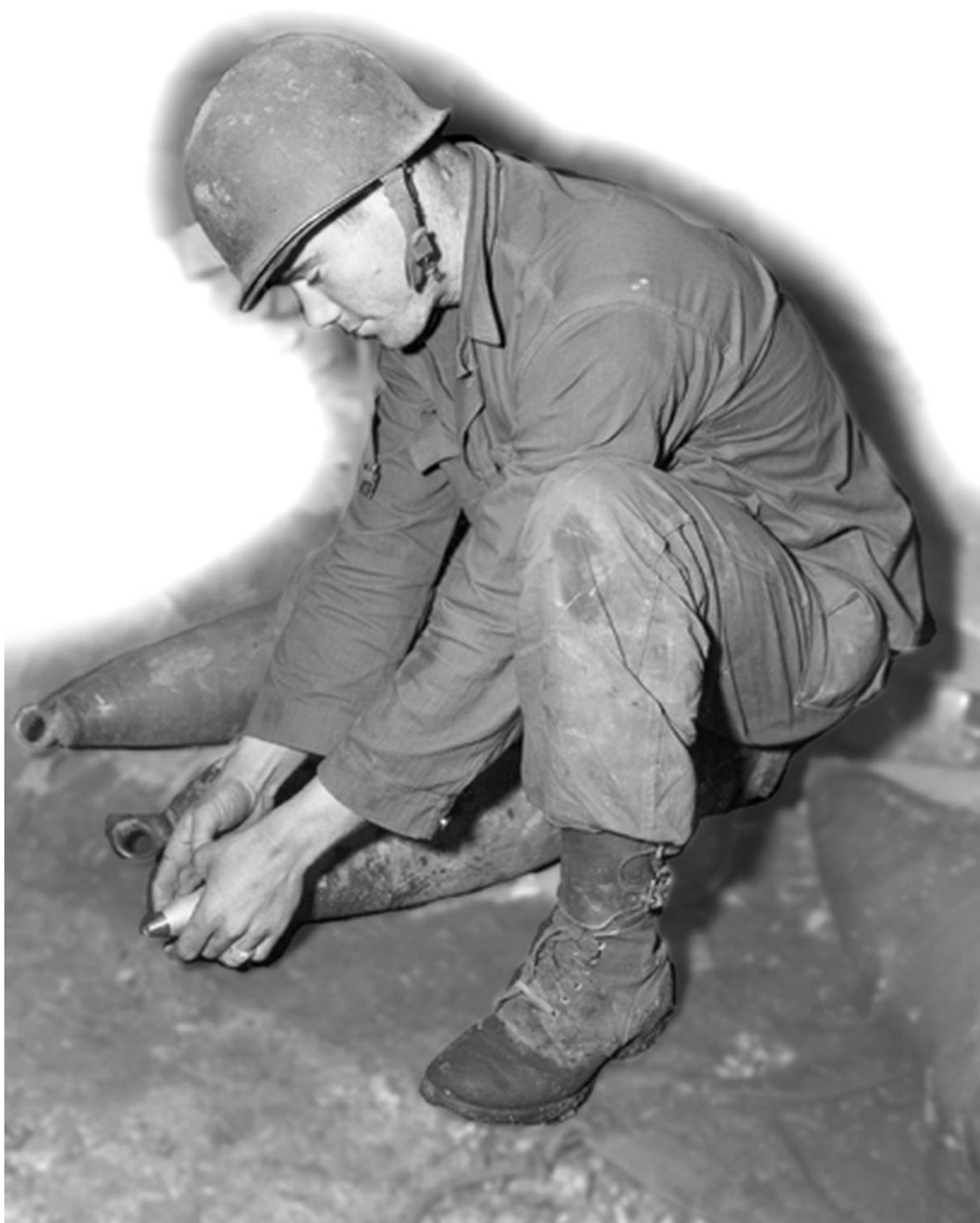
Un GI manipulant un obus

Les conditions de vie sont particulièrement difficiles, au dedans comme à l'extérieur des limites du siège. Le ravitaillement est mal assuré.