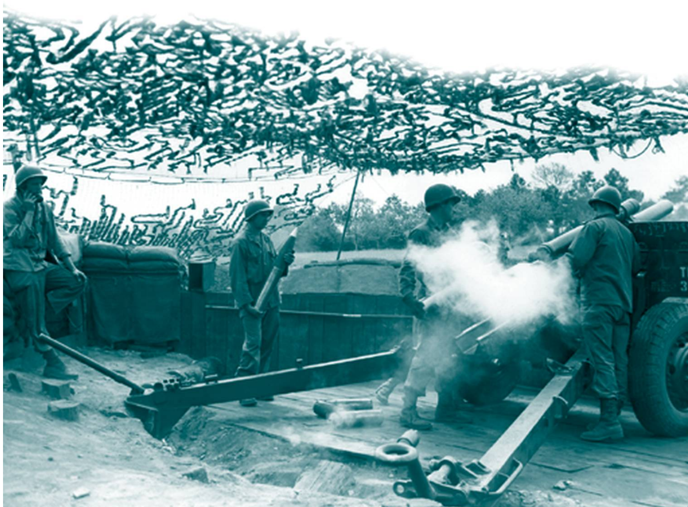
Batterie américaine pilonnant les positions allemandes