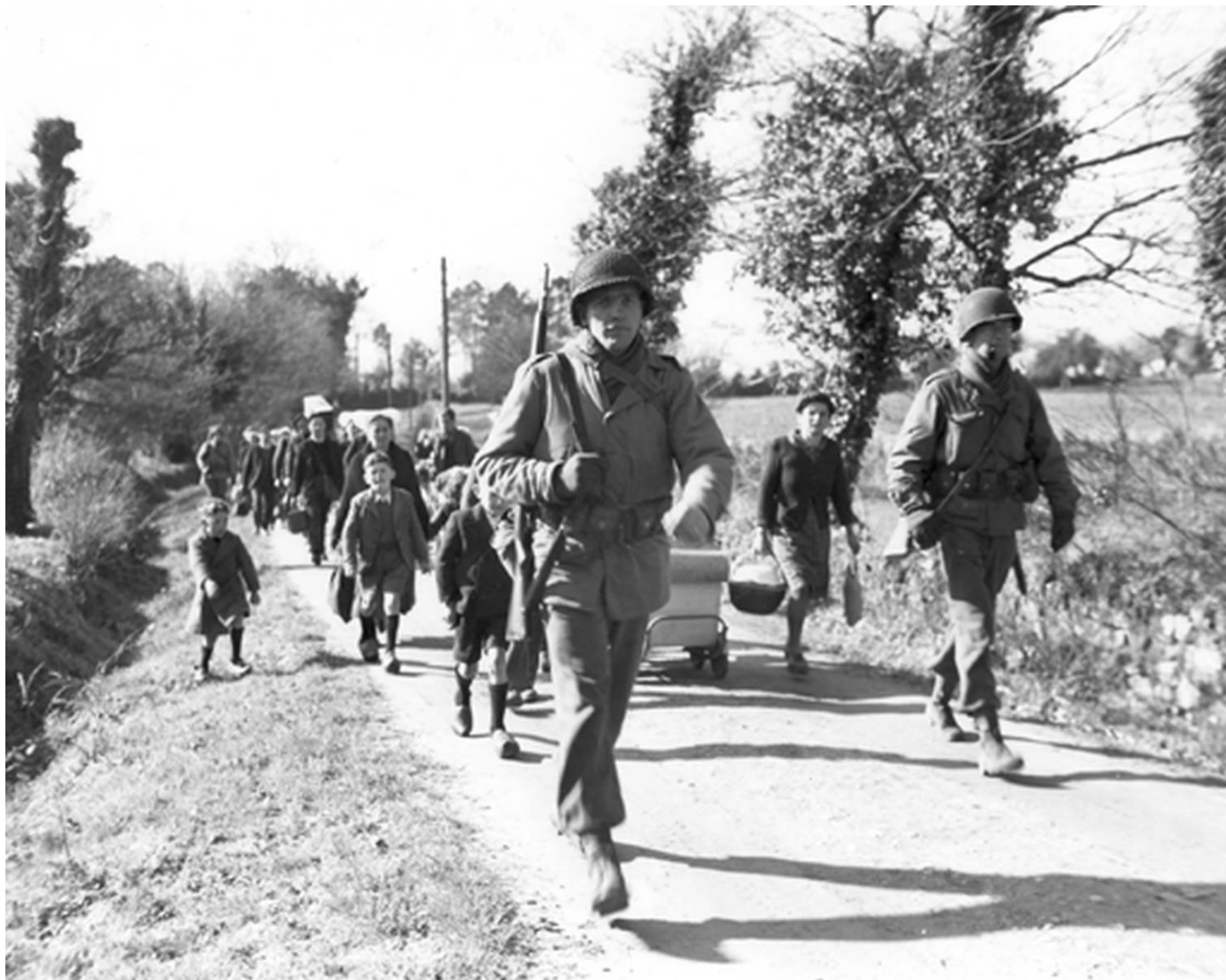
Colonne de réfugiés près de Guidel