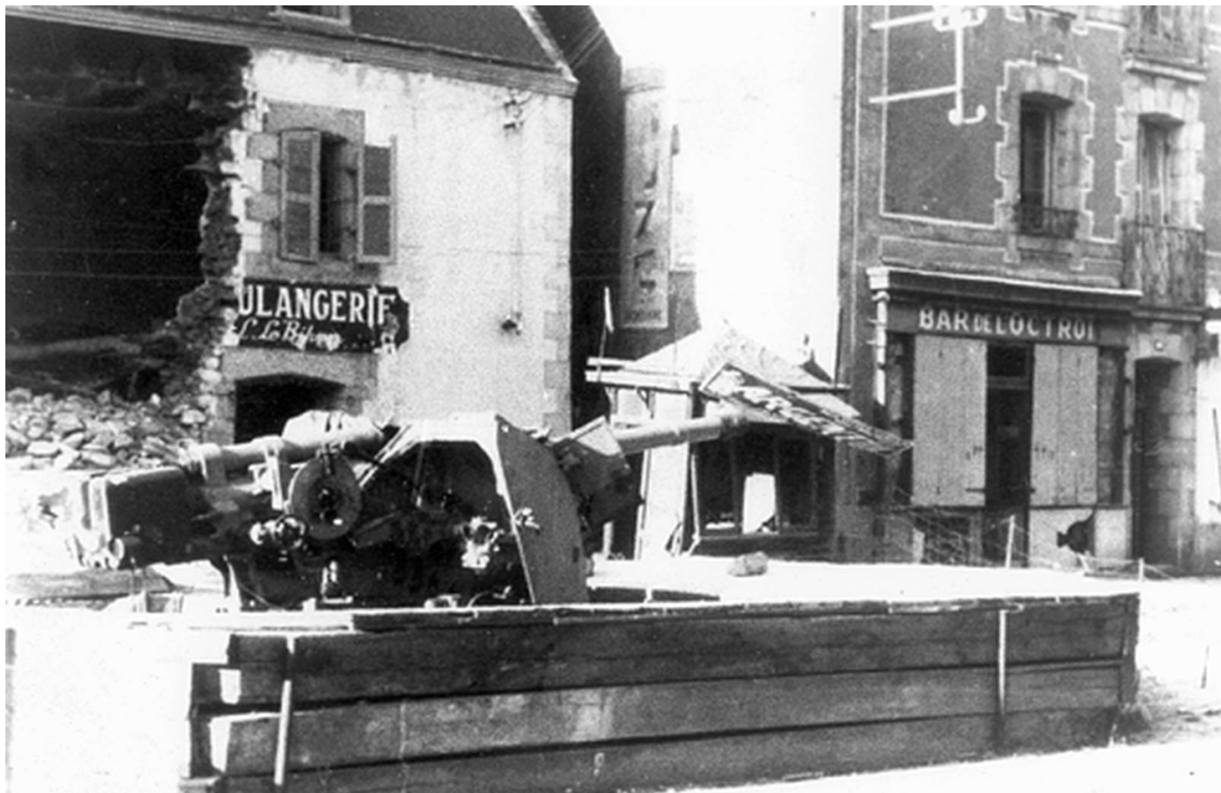
Artillerie allemande rue Paul Guieysse à Lorient