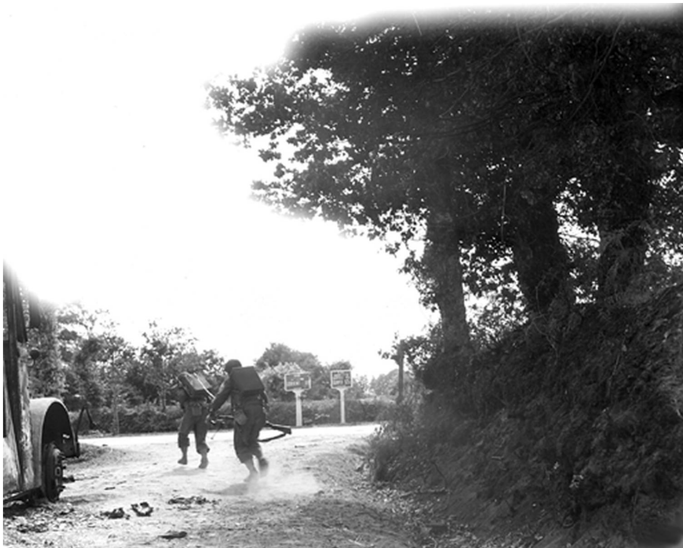
Combats pour la prise de Lorient sur la RN165 près de Gestel