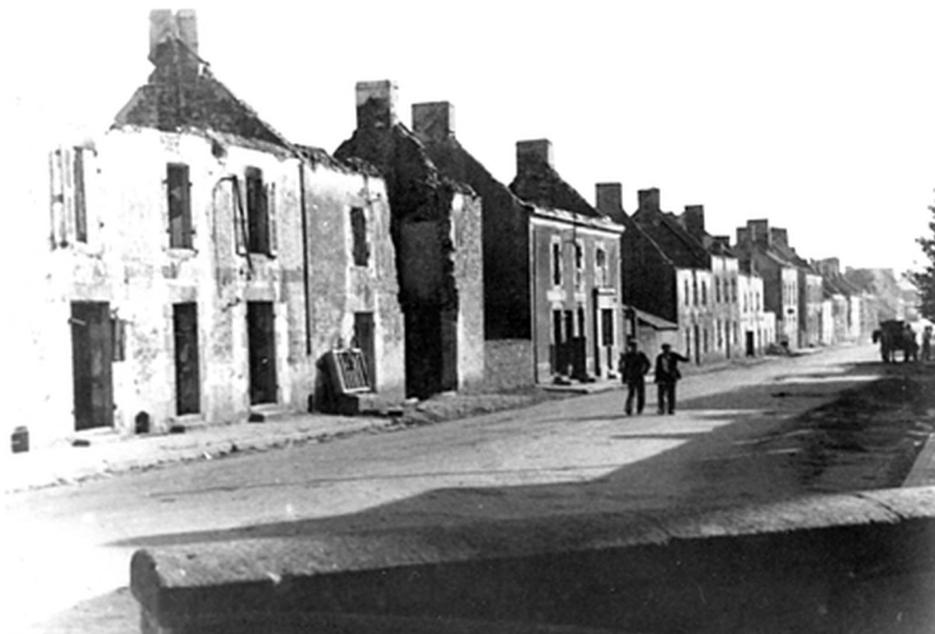
Le centre de Quéven détruit