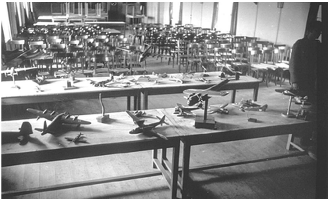
Salle d'identification des appareils à Lann-Bihoué

Le Festung abrite deux équipements majeurs : la base des sous-marins et le terrain d'aviation de Kerlin-Bastard (futur Lann Bihoué). Il compte au total plus de 400 blockhaus, nids de mitrailleuses, tours de guet, hôpitaux souterrains, ateliers de maintenance... 400 000 m 3 de béton sont nécessaires à la réalisation de la défense de la région lorientaise (hors base des sous-marins). Par ailleurs, de nombreux dépôts d'armes sont disposés sur le territoire : au nord de l'étang du Ter (Ploemeur), à Kersalo (Pont Scorff) avec des installations de la Kriegsmarine , un dépôt de cones de combat à Mentec (rive droite du Scorff), deux autres sur les rives du Scorff, un dans la citadelle de Port Louis. Enfin, à proximité de la base des sous-marins, six bunkers abritent les torpilles des sous-marins.