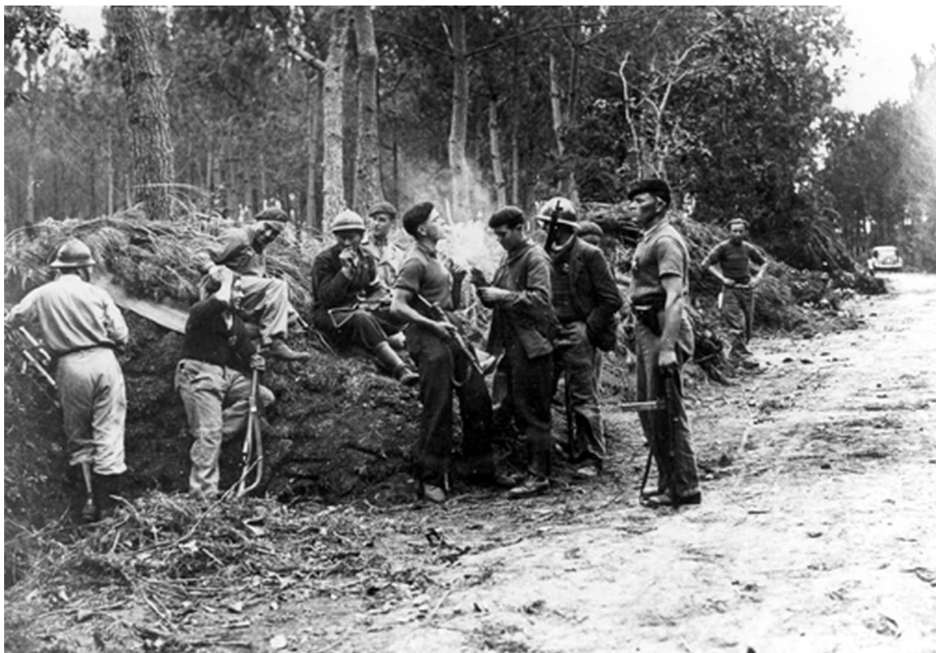
Groupe de FFI faisant une pause pour fumer