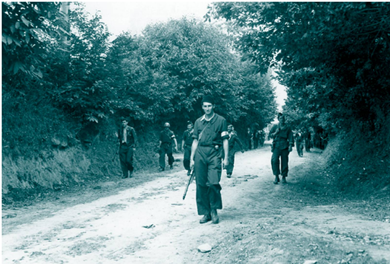
Maquisard du 7e bataillon FFI