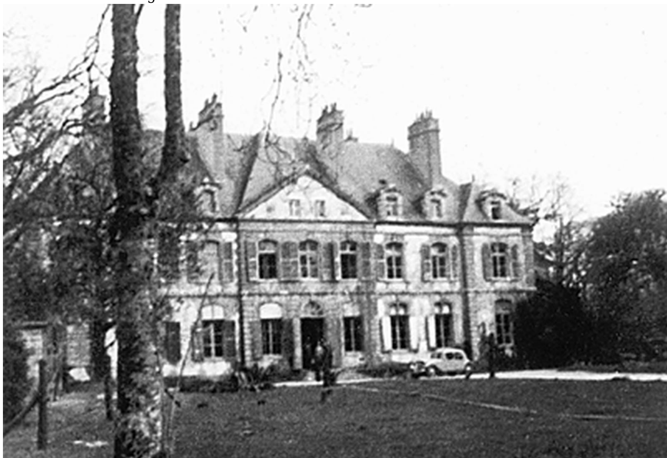
Le château de Kerrousseau