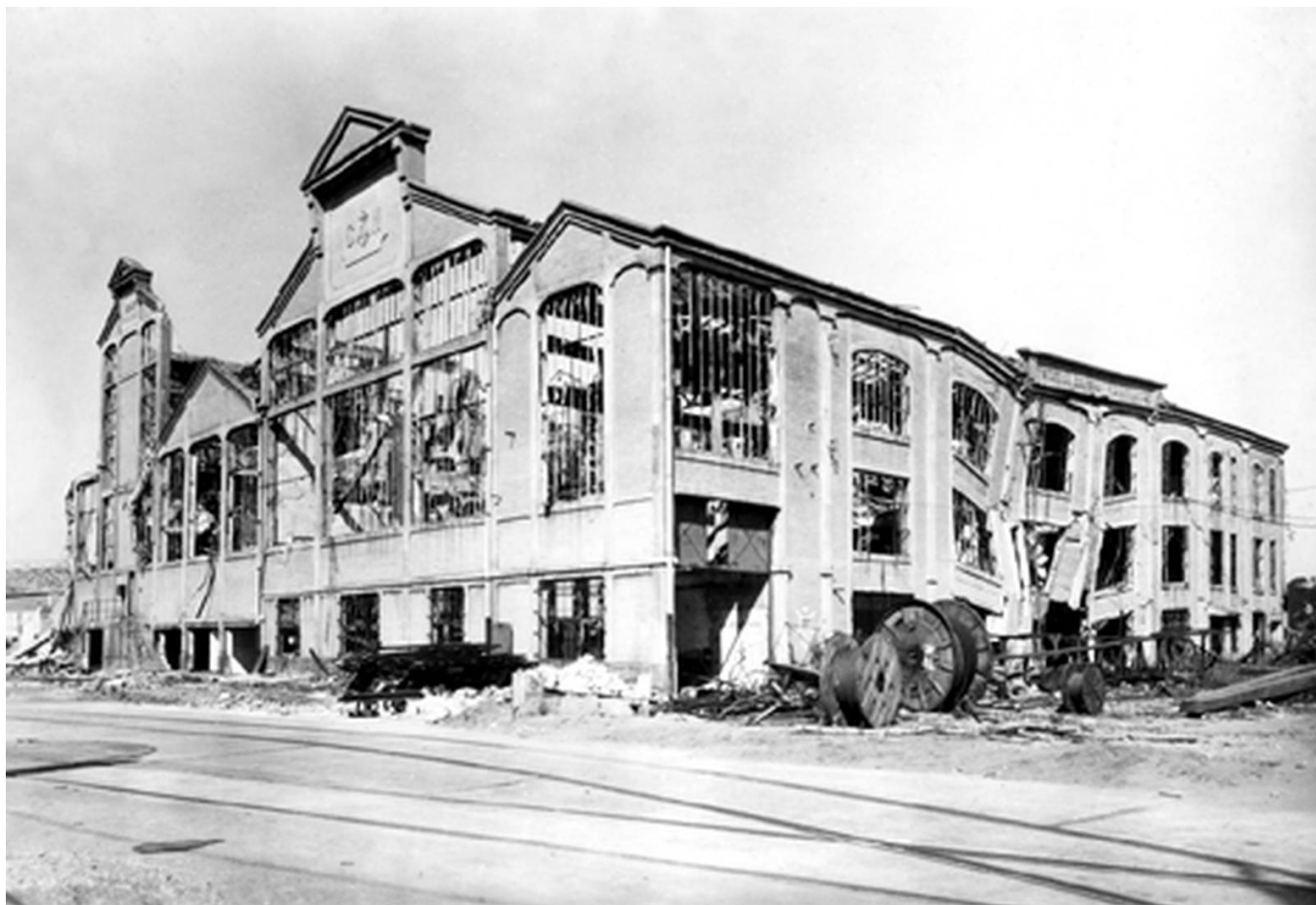
La centrale électrique de l'arsenal après les bombardements

Guidel le 3 février). Le 1 er objectif est la neutralisation mutuelle des points d'observation et des batteries. Le 24 septembre, la puissante batterie du Bégot est sous le feu des Alliés mais sans dégâts majeurs. Le 17 octobre, les FFI réitèrent les tirs depuis Saint-Colomban ; le 4 novembre, les tirs de la batterie atteignent le chapelle Saint-Michel près de Carnac.