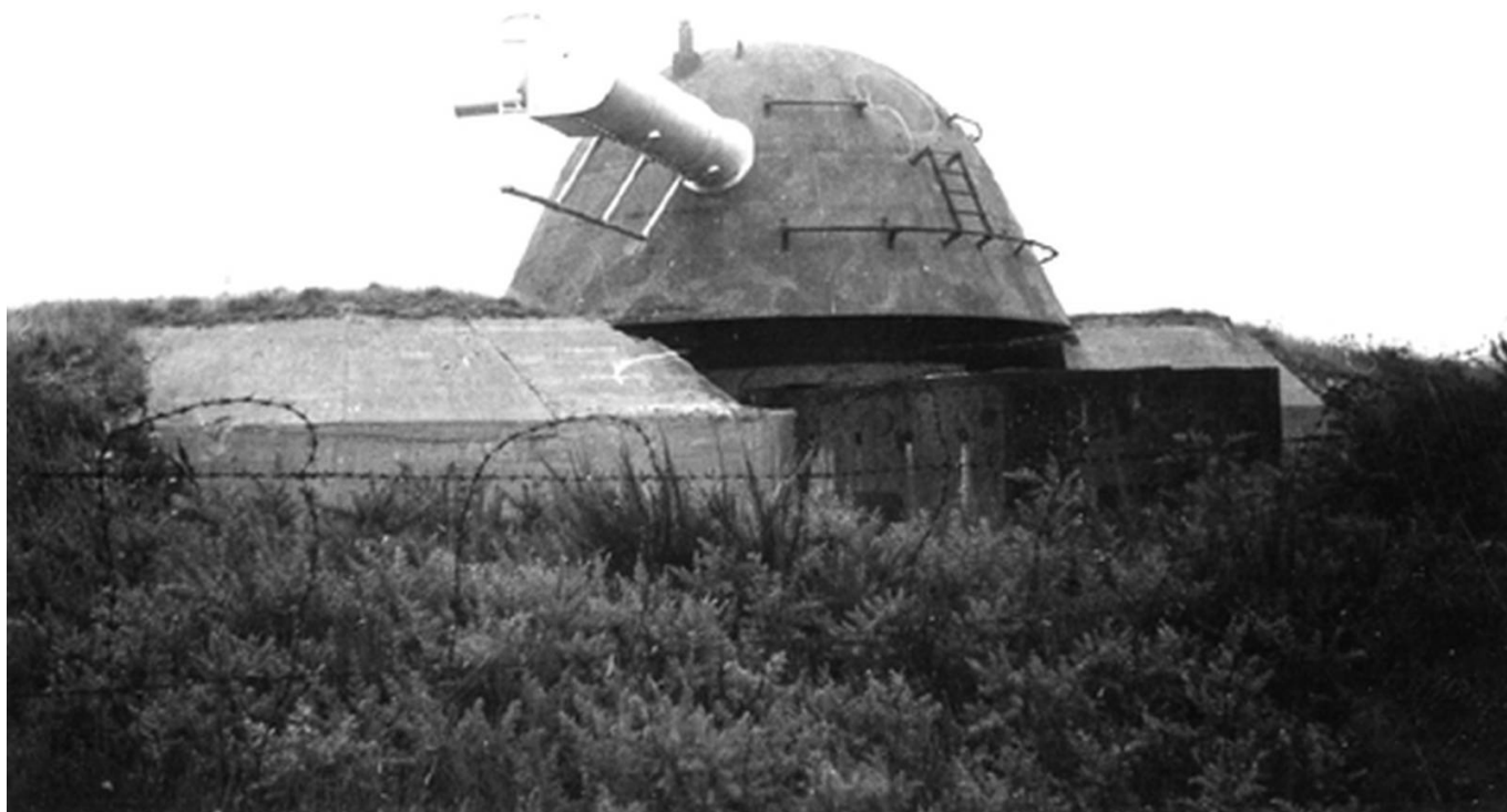
Télémètre de la batterie du Grognon sur île de Groix