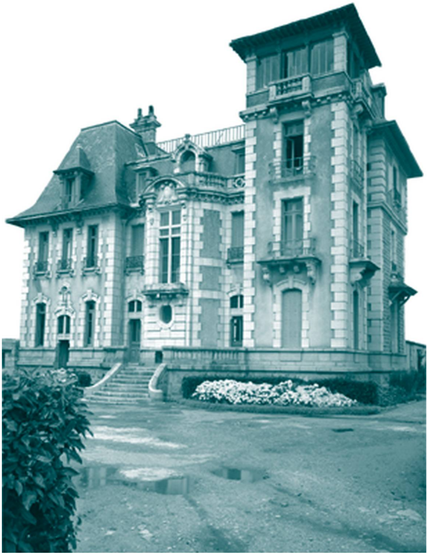
villa Kérilon à Larmor-Plage