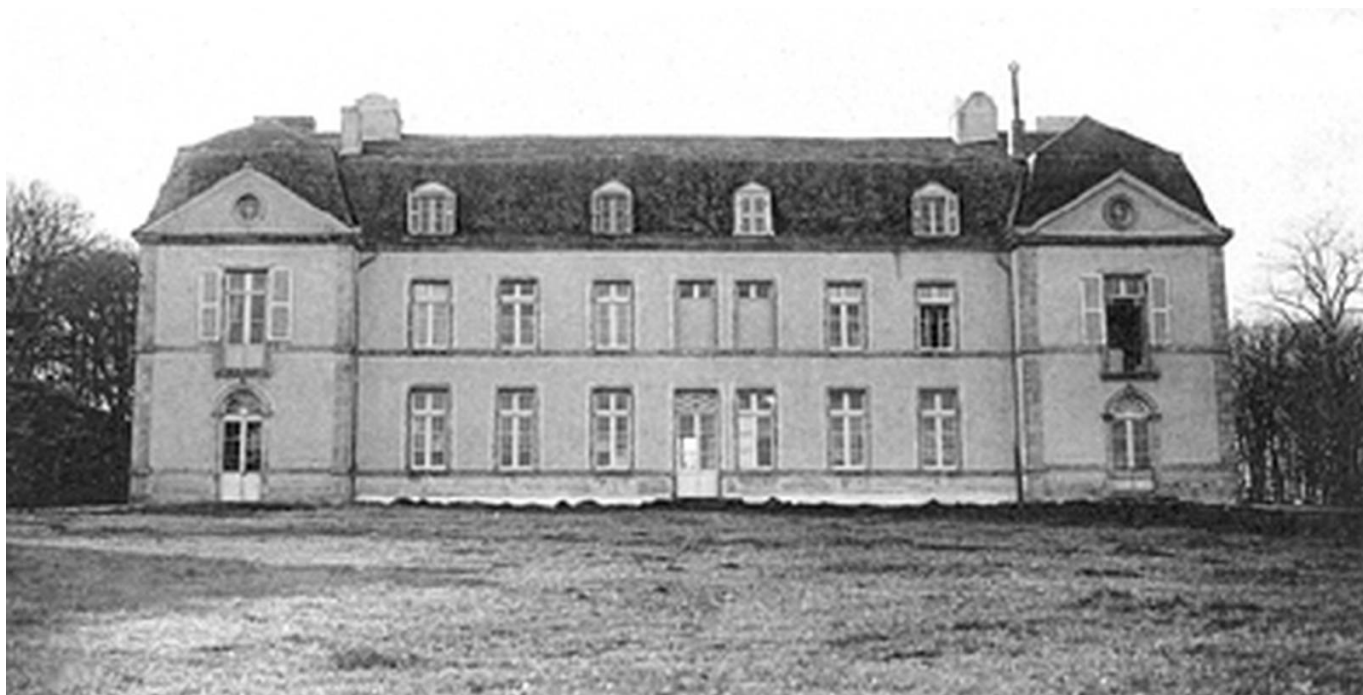
Le château du Ter