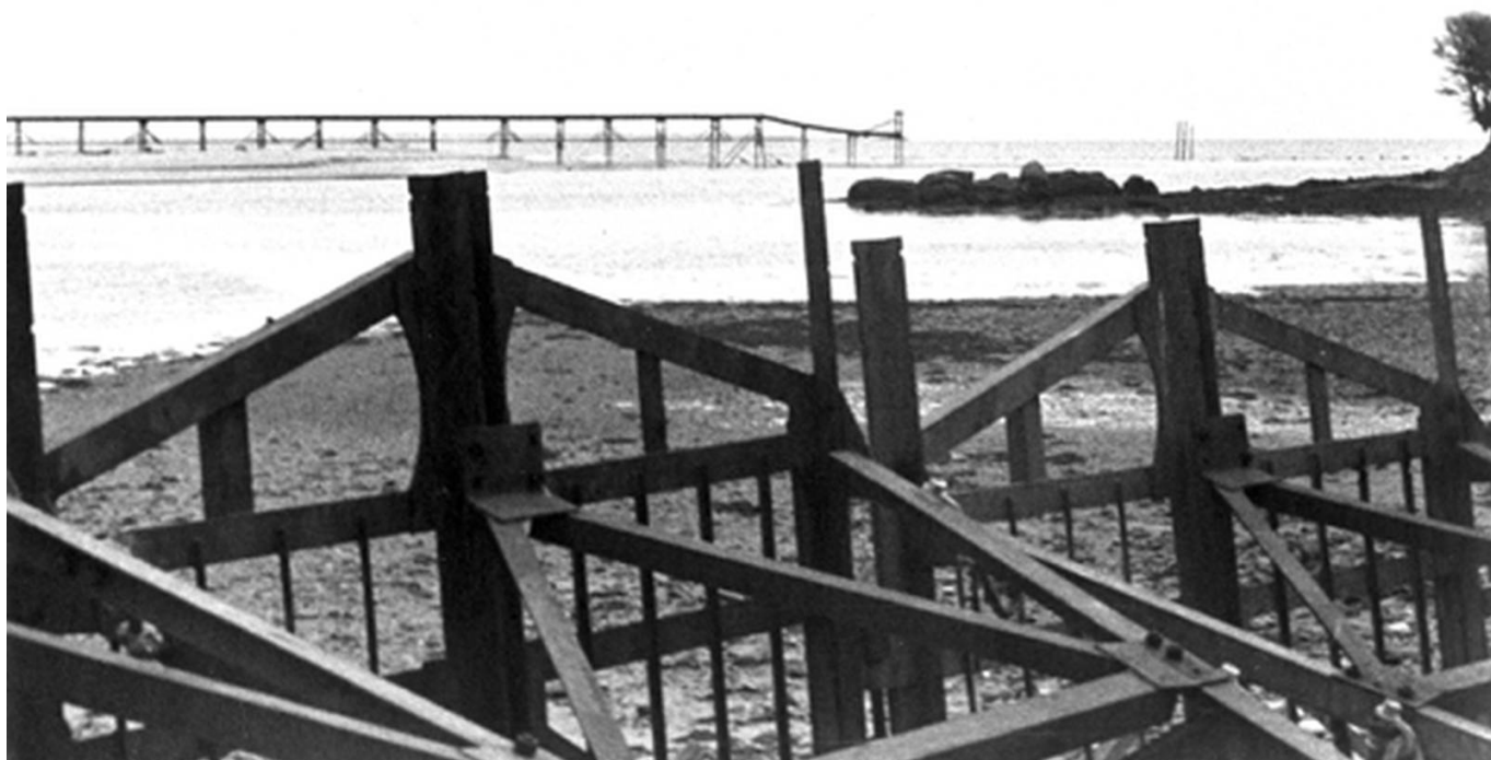
Obstacles à l'embouchure de la Laïta