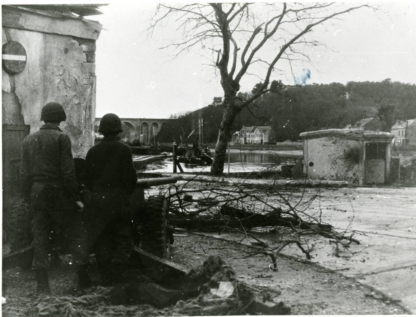
Soldats alliés sur les bords du Blavet à Hennebont