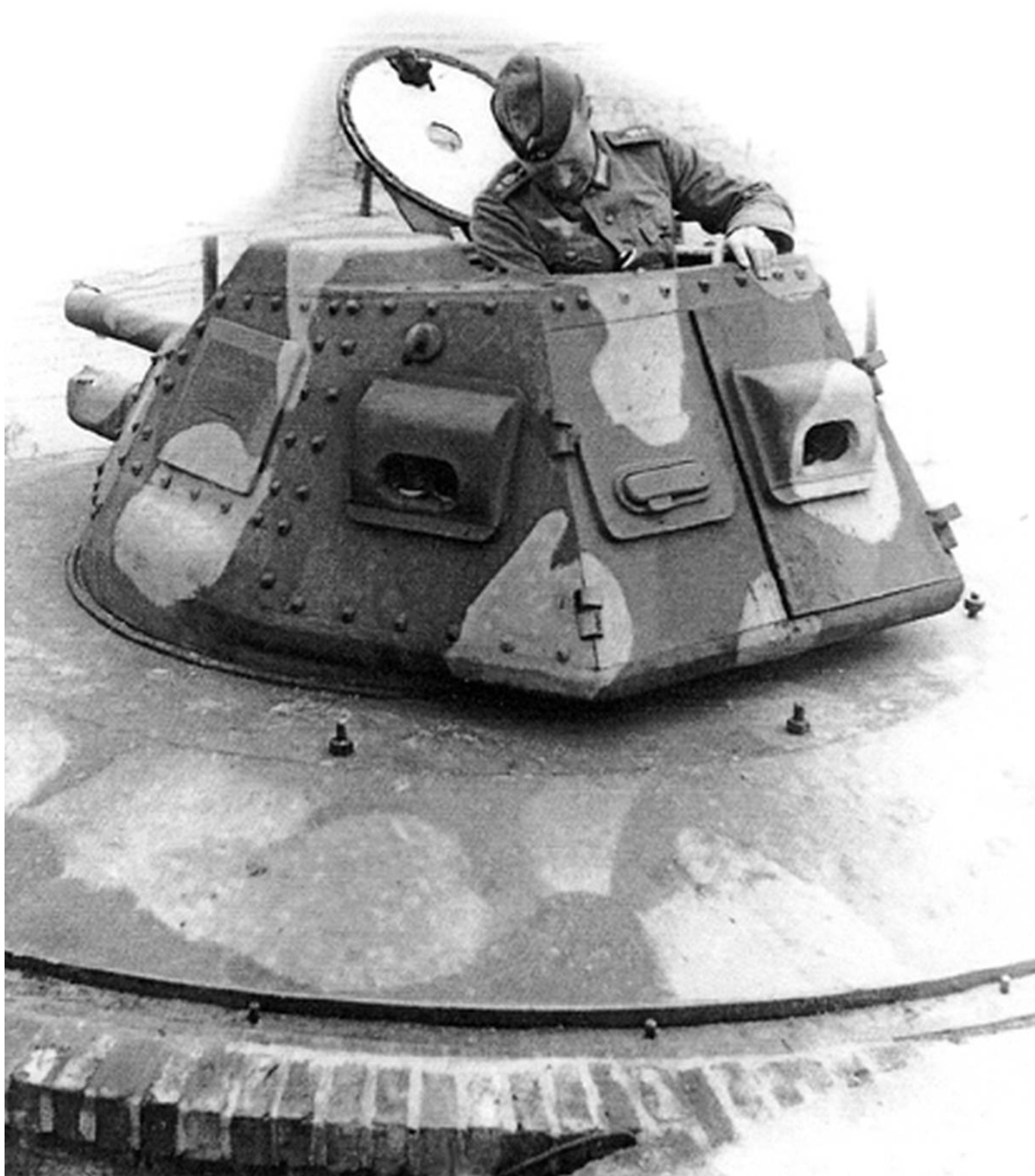
Défense côtière allemande