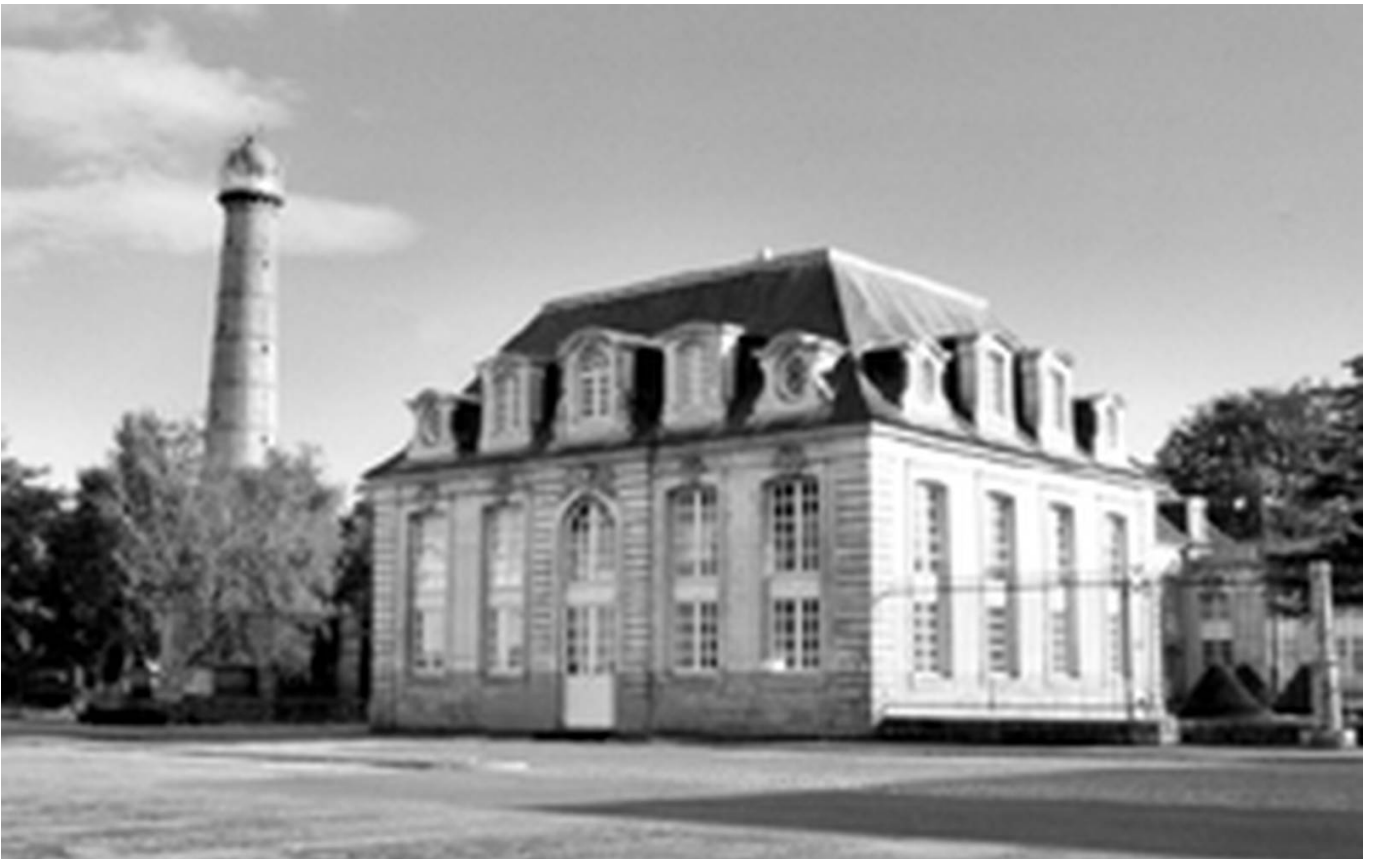
Le pavillon Gabriel