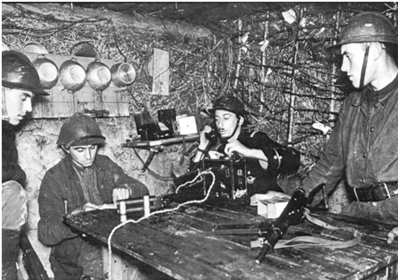
Poste de commandement dans une cahute sur le front