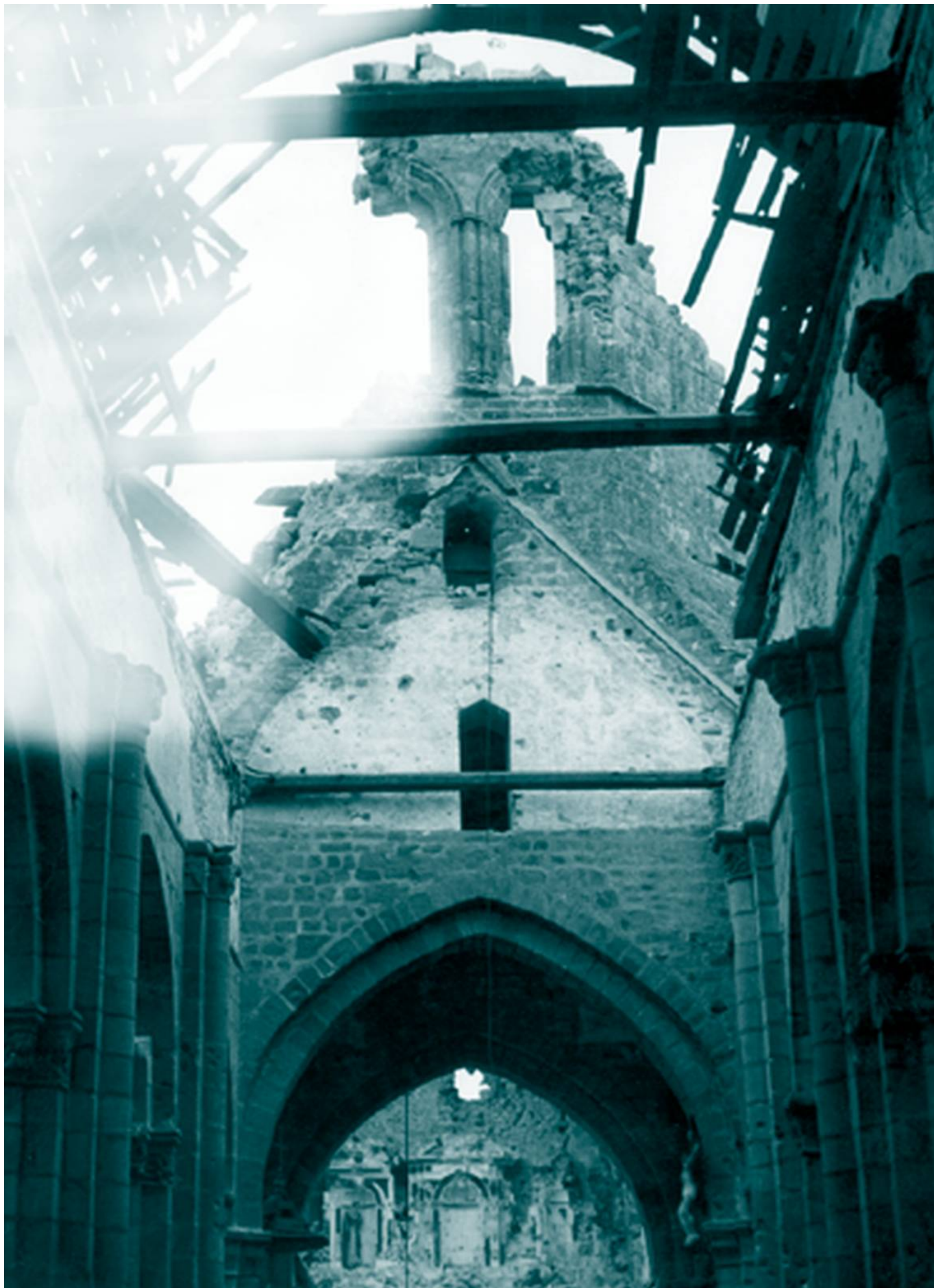
L'église de Guidel