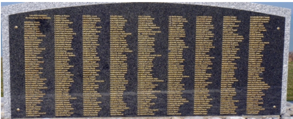
TORPILLAGE DU MEKNÈS ET VICTIMES MORBIHANNAISES