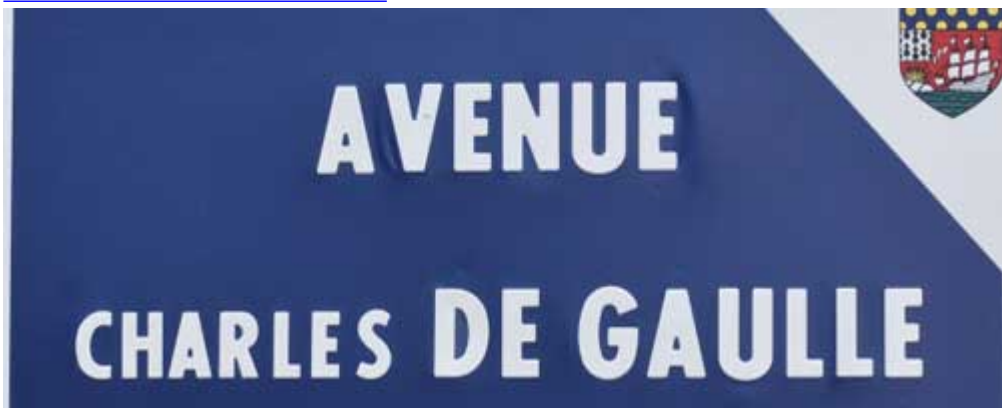
LES RUES 1939-1945