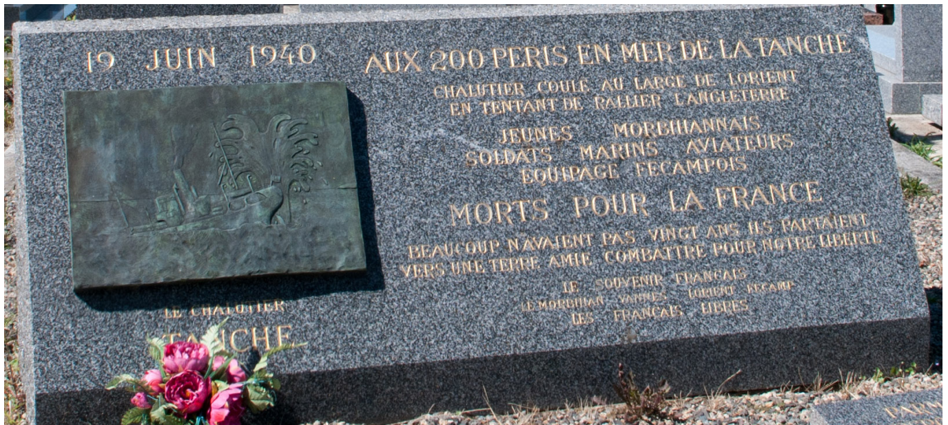
VICTIMES DU CHALUTIER LA TANCHE