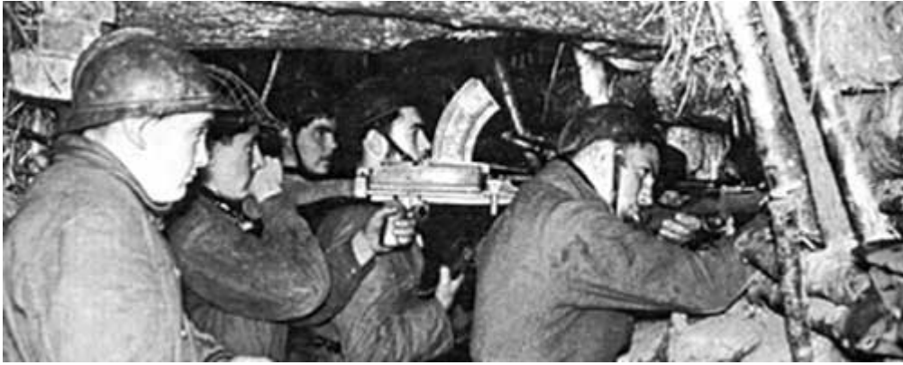
LA POCHE DE LORIENT