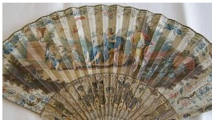
OBJETS ET MOBILIERS