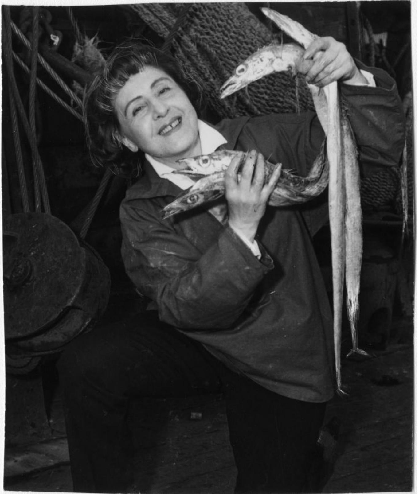
Chalutier Deux Amis - portrait de Anita Conti avec des poissons sabres - 1960-1961 24Fi28007 inconnu