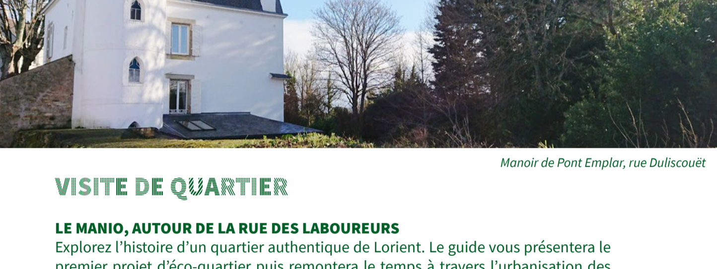
Manoir de Pont Emplar, rue Duliscouët

02 97 02 22 42 - archives@mairie-lorient.fr - http://archives.lorient.bzh