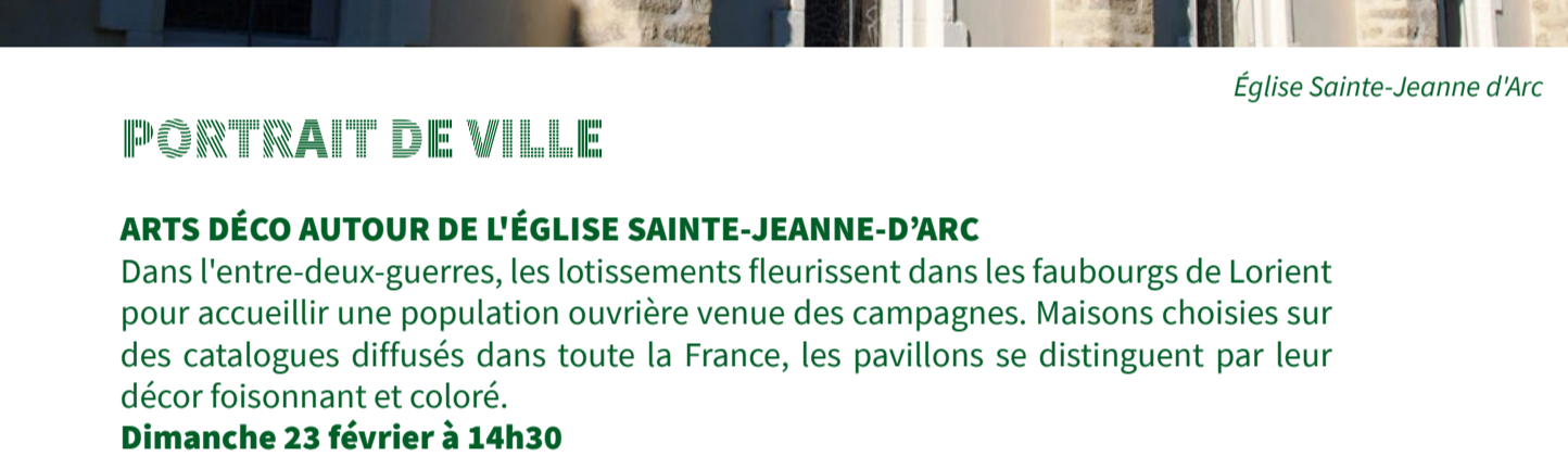
Église Sainte-Jeanne d'Arc

Départ de la visite à l'entrée du jardin du Manio, rue des Laboureurs