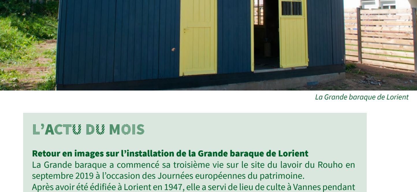
La Grande baraque de Lorient