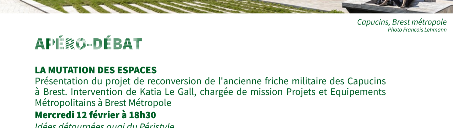
Capucins, Brest métropole

Départ de la visite sur le parvis de la Cité de la Voile