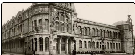
ETABLISSEMENTS CULTURELS ET DE