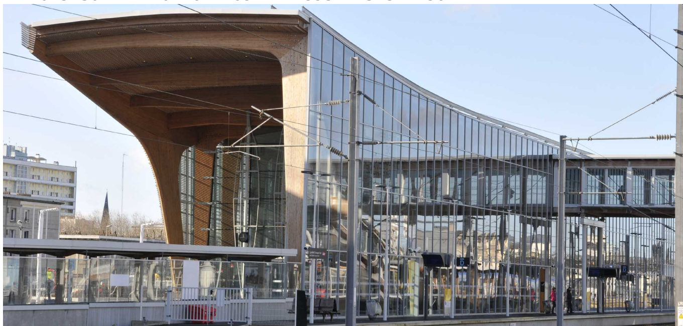
Gare SNCF en 2018

1862 1885 1911 1943 1961 1985 1988 1991 2014 2017 21h25 13h30 11h17 10h26 7h26 5h22 4h59 3h44 3h37 2h56