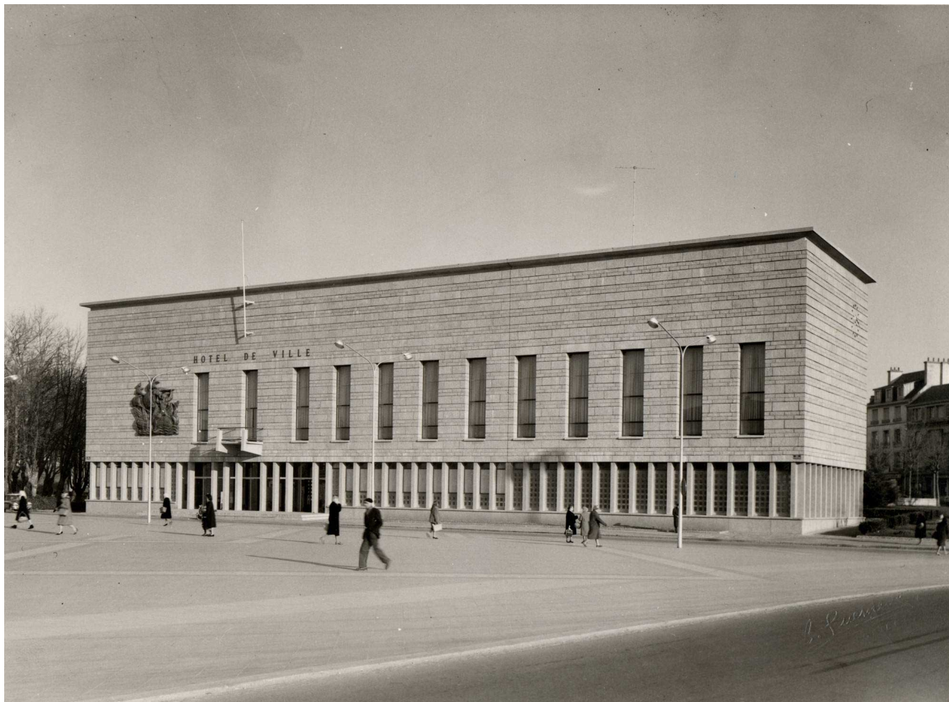
Hôtel de ville en 1960

La mairie d'avant-guerre se situait rue Jules Le Grand. L'hôtel de ville actuel n'a pas été rebâti au même emplacement. Il tient un rôle essentiel dans la stratégie de déplacement du centre ville ancien inscrite dans le plan de reconstruction de Lorient. Le futur bâtiment sera l'élément phare de la ville nouvelle. Le projet de reconstruction de l'hôtel de ville, dressé dès 1946 par les architectes Jean-Baptiste Hourlier, architecte en chef des bâtiments civils et des palais nationaux, premier Grand Prix de Rome, associé à l'architecte Henri Réglain de Lorient, fut approuvé par le conseil municipal du 17 décembre 1955. Les travaux d'édification, précédés de fondations spéciales, par pieux battus en sol mou, débutent en janvier 1957. Le bâtiment est construit en granit du pays et en béton armé. Les travaux s'achèvent en juillet 1960 .