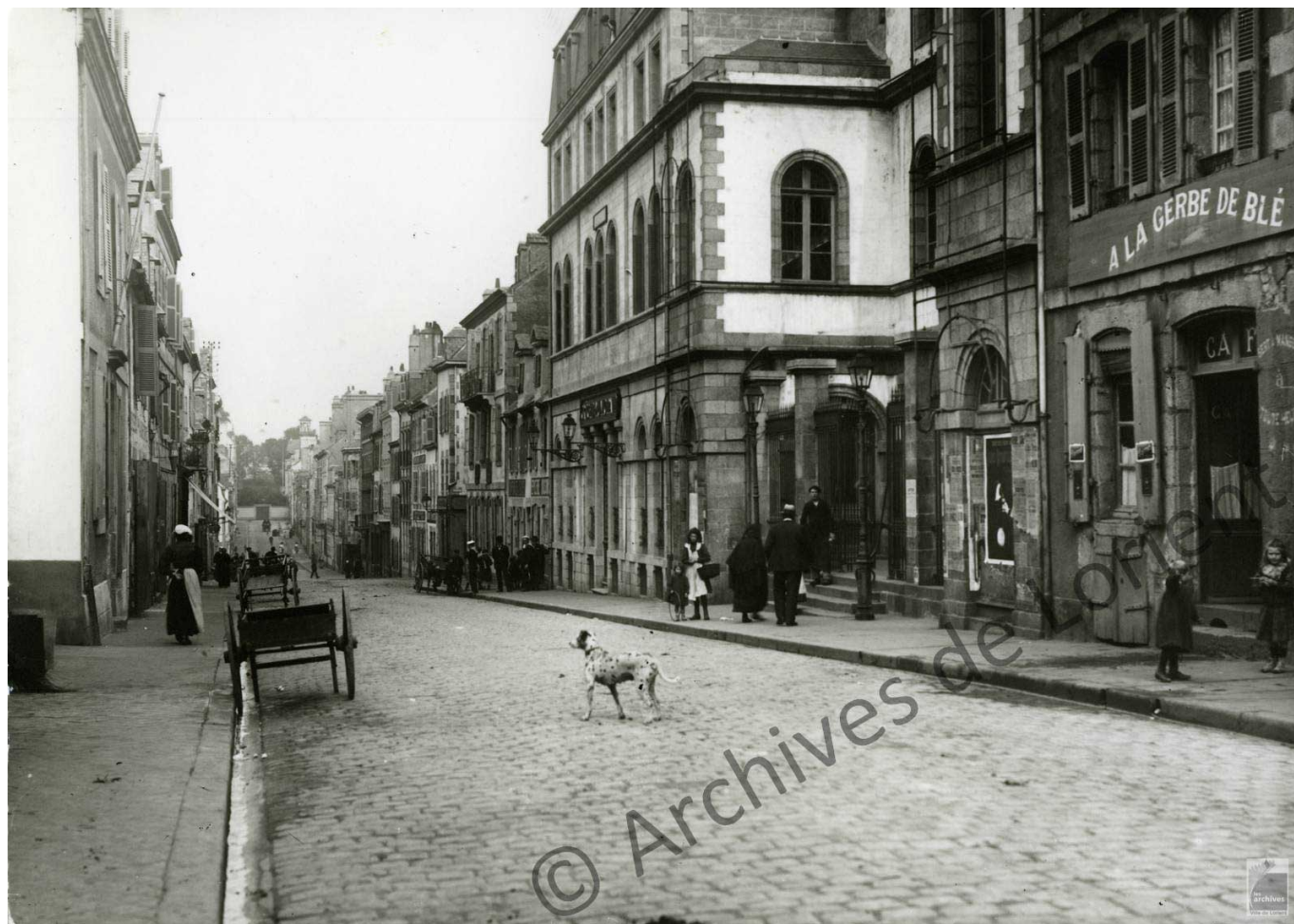
Mairie au début du XXe siècle - 5Fi1674

Outre les bureaux, sont aménagés dans les locaux côté cour une salle pour stocker les pompes à incendie et un petit local pour la vérification des poids et mesures. S'y trouve également, le poste de police de la Communauté ainsi qu'un héraut, 2 archers, 2 valets et un tambour. Aux étages supérieurs du bâtiment principal, se situe un vaste appartement de plusieurs pièces avec cuisine, aménagé en 1755 pour les seigneurs et commandants de la Province effectuant leurs tournées ainsi qu'une salle pour les assemblées de la Communauté.