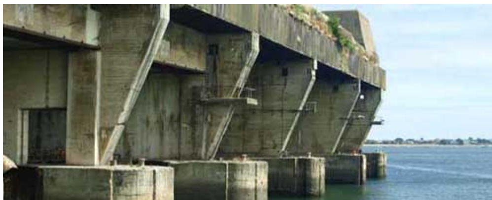
BASE DE SOUS-