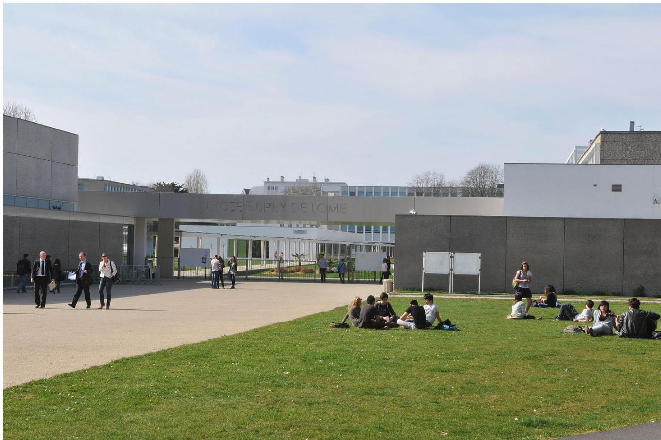
COLLÈGE COMMUNAL (ANCÊTRE DU LYCÉE DUPUY DE LÔME) COLLÈGE DE KERENTRECH COLLÈGE DE TRÉFAVEN