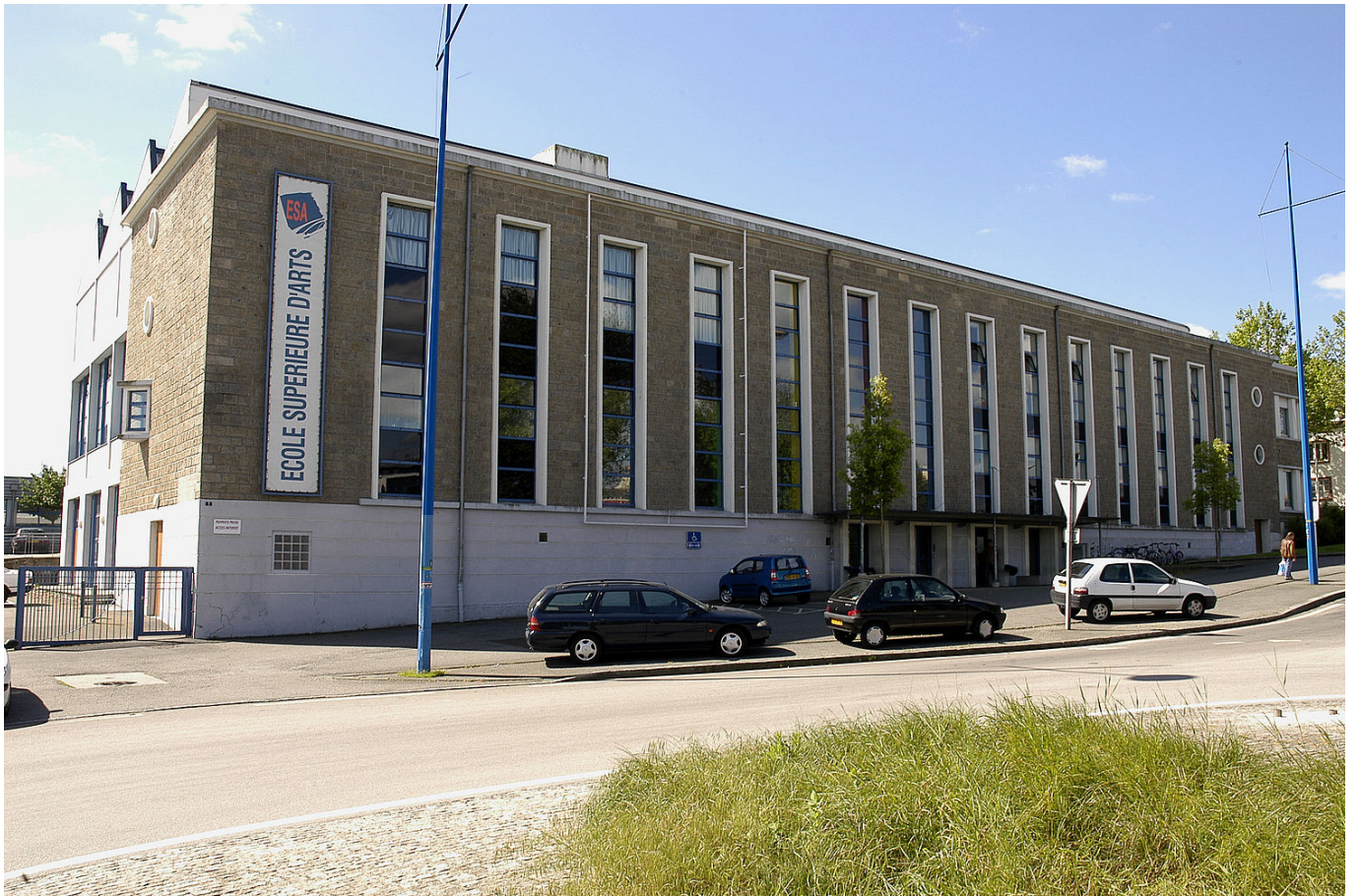
ÉCOLE D'ART DE LORIENT