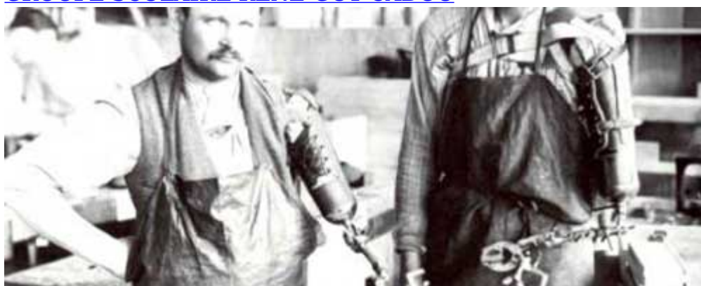
ÉCOLE DE RÉÉDUCATION DES MUTILÉS