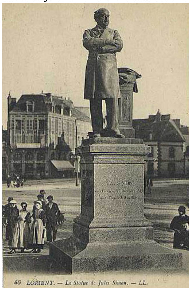
Statue de Jules Simon après 1907