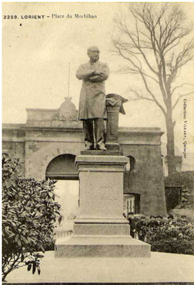
Statue de Jules Simon avant la destruction des remparts et de la Porte du Morbihan