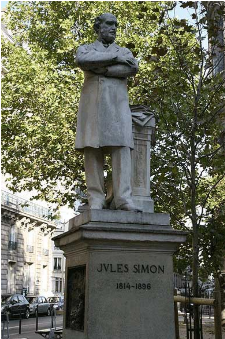
Plan rapproché de la statue de Jules Simon à Paris

La statue était installée place du Morbihan, correspondant à l'actuelle place Clémenceau ; la statue tourne le dos à la ville et regarde en direction du Cours de Chazelles. Le monument, statue et bas-reliefs, réquisitionné au début de la Seconde Guerre mondiale, a été fondu ; le socle, endommagé par les bombardements a été disloqué à la Reconstruction.