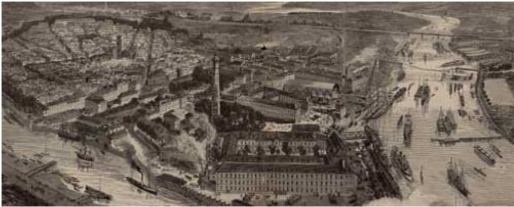
LE XIXÈ SIÈCLE