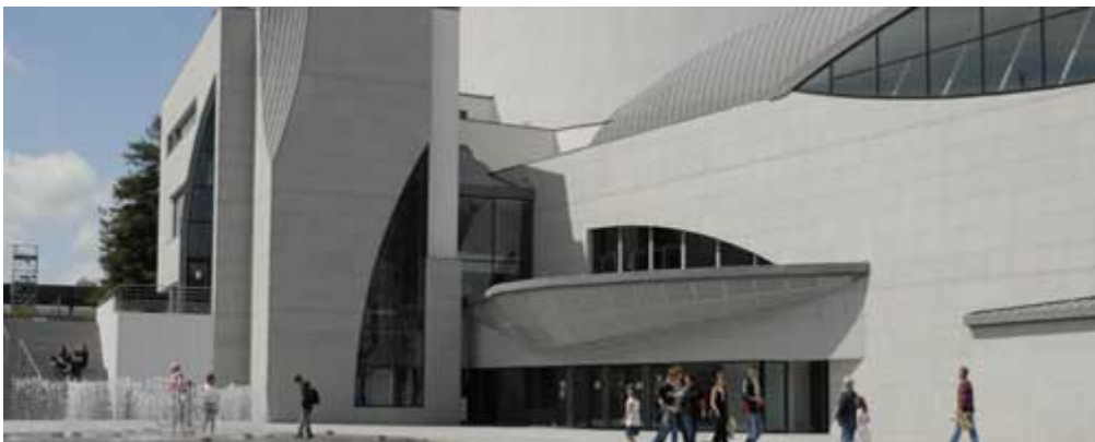
LE XXIÈ SIÈCLE