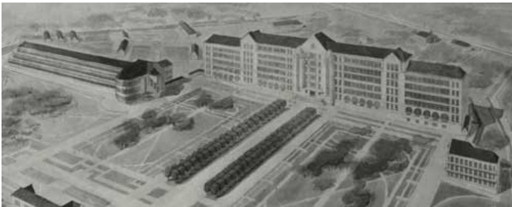
LE XXÈ SIÈCLE