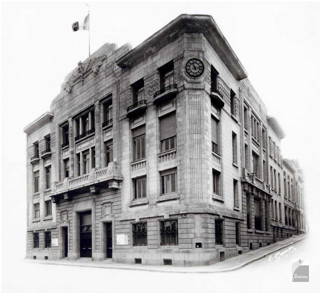
PRÉSIDENTS CHAMBRE DE COMMERCE ET D'INDUSTRIE