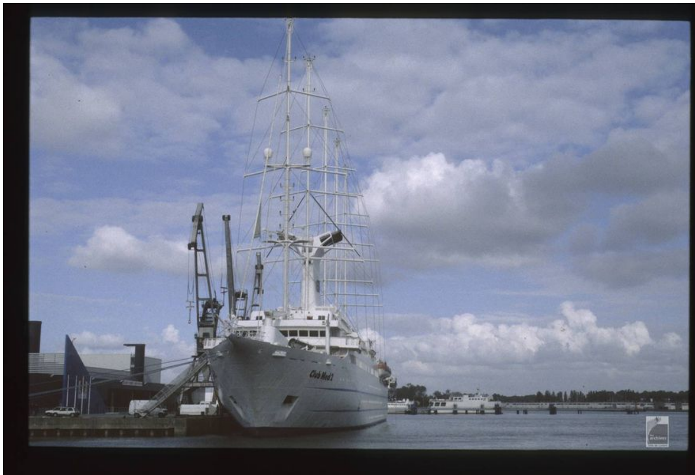
Club Med 2