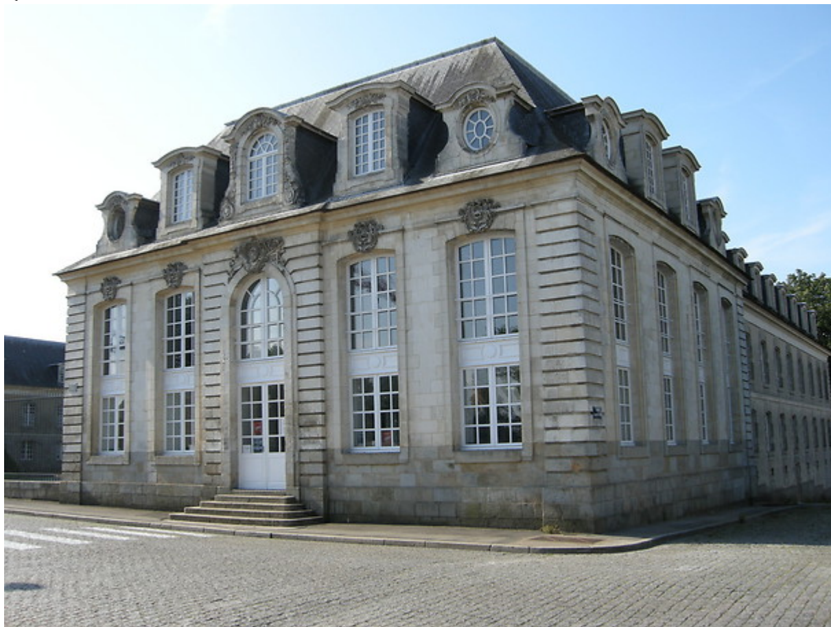
Quittance droits d'auteur à la SACEM - 1946