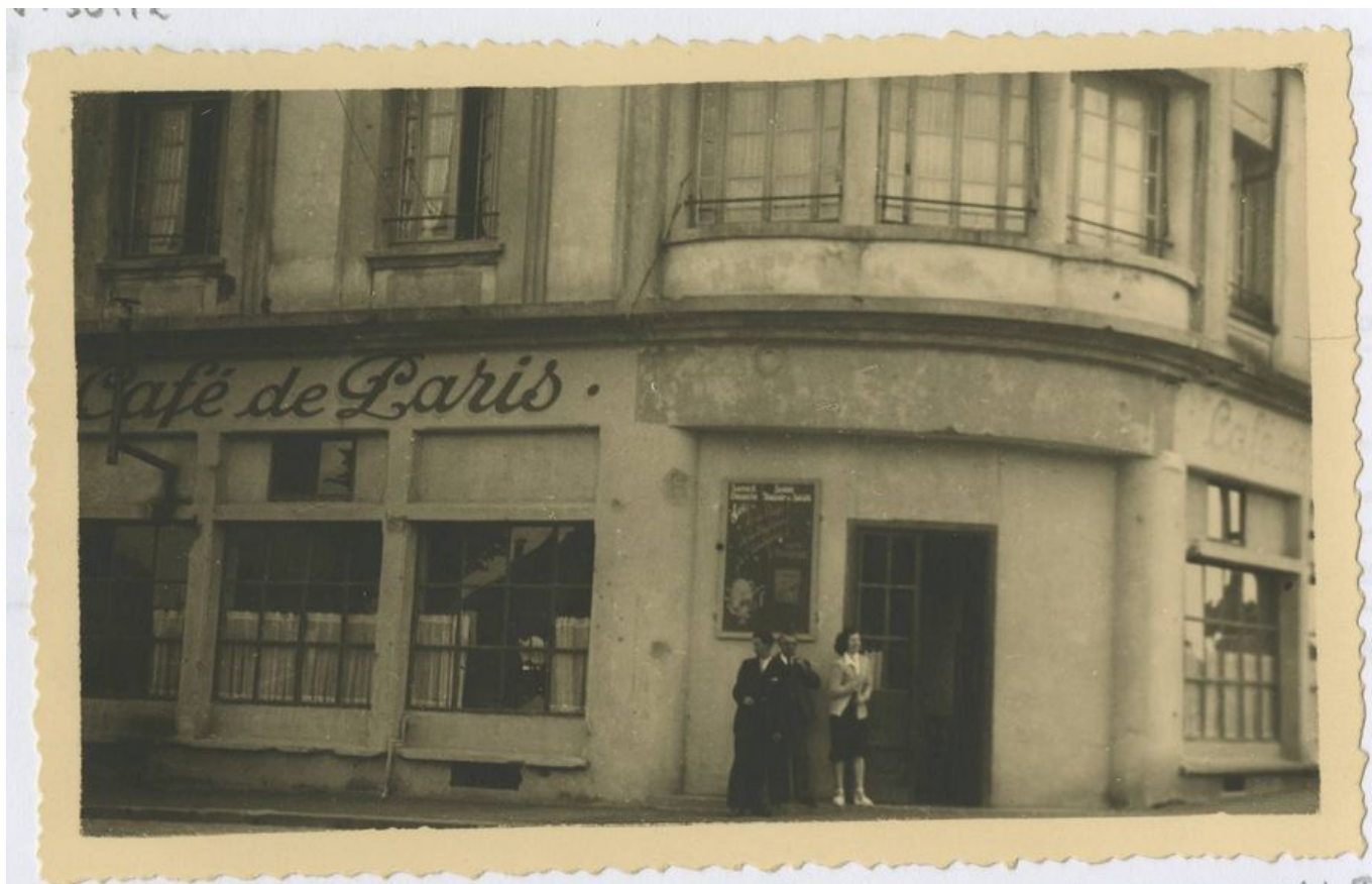
Café de Paris