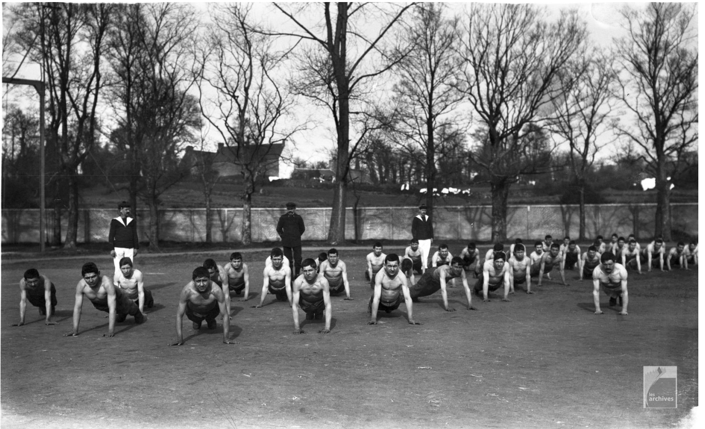
NAISSANCE DE LA PRATIQUE DES SPORTS À LORIENT