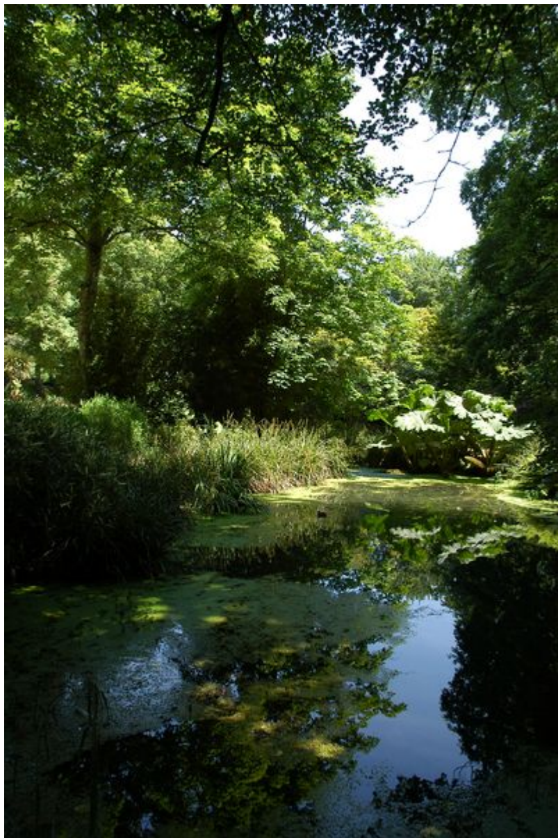
Plan d'eau et jardin exotique