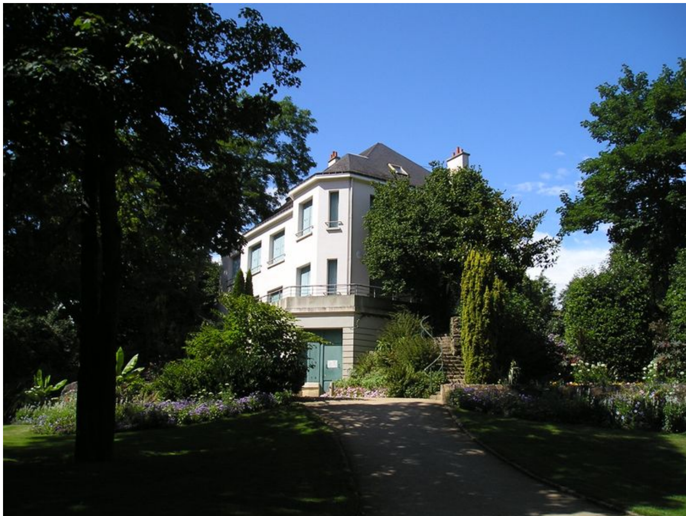
Maison au jardin Chevassu

À l'origine, les terrains de l'actuel parc Chevassu sont situés dans un vallon, bordé d'anciennes carrières désaffectées, au lieu-dit Le Burtul - Le Mir en Ploemeur.