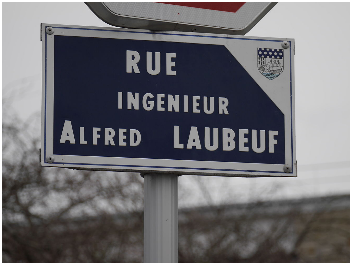
Rue Ingénieur Alfred Laubeuf