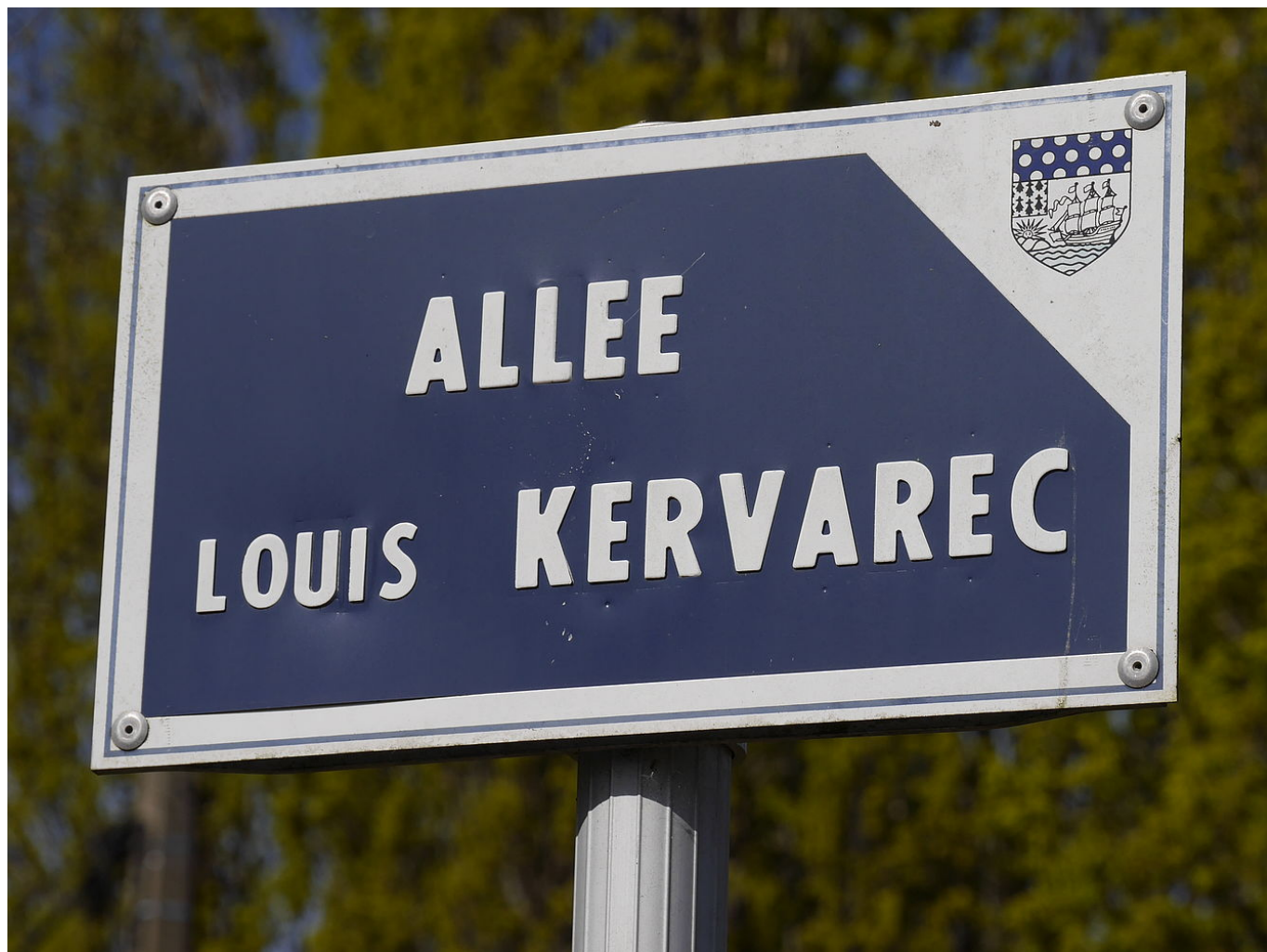
Allée Louis Kervarec