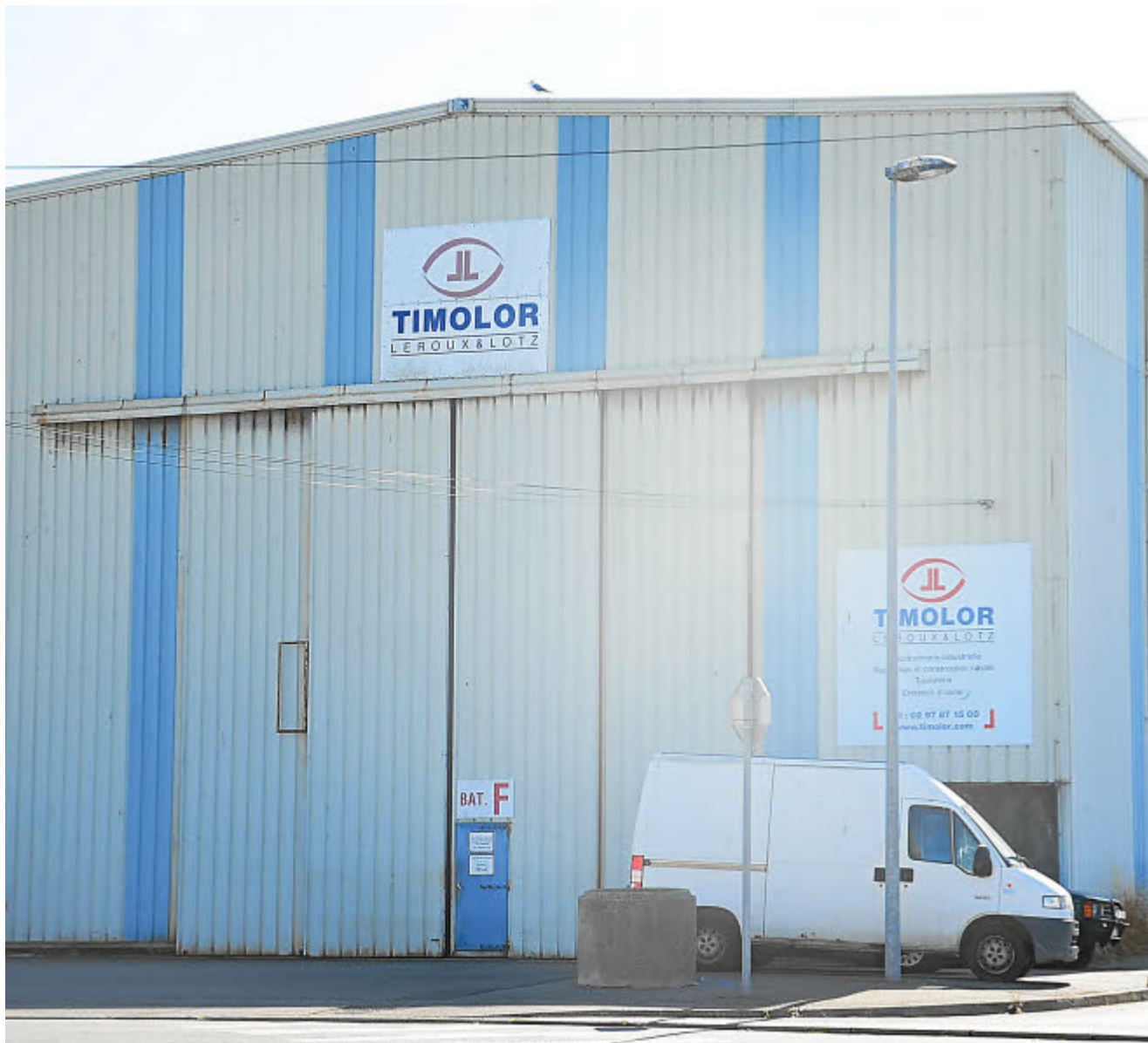
Local de Timolor à Keroman