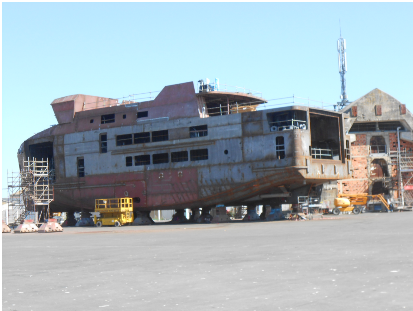
Le roulier en cours de fabrication au slipway