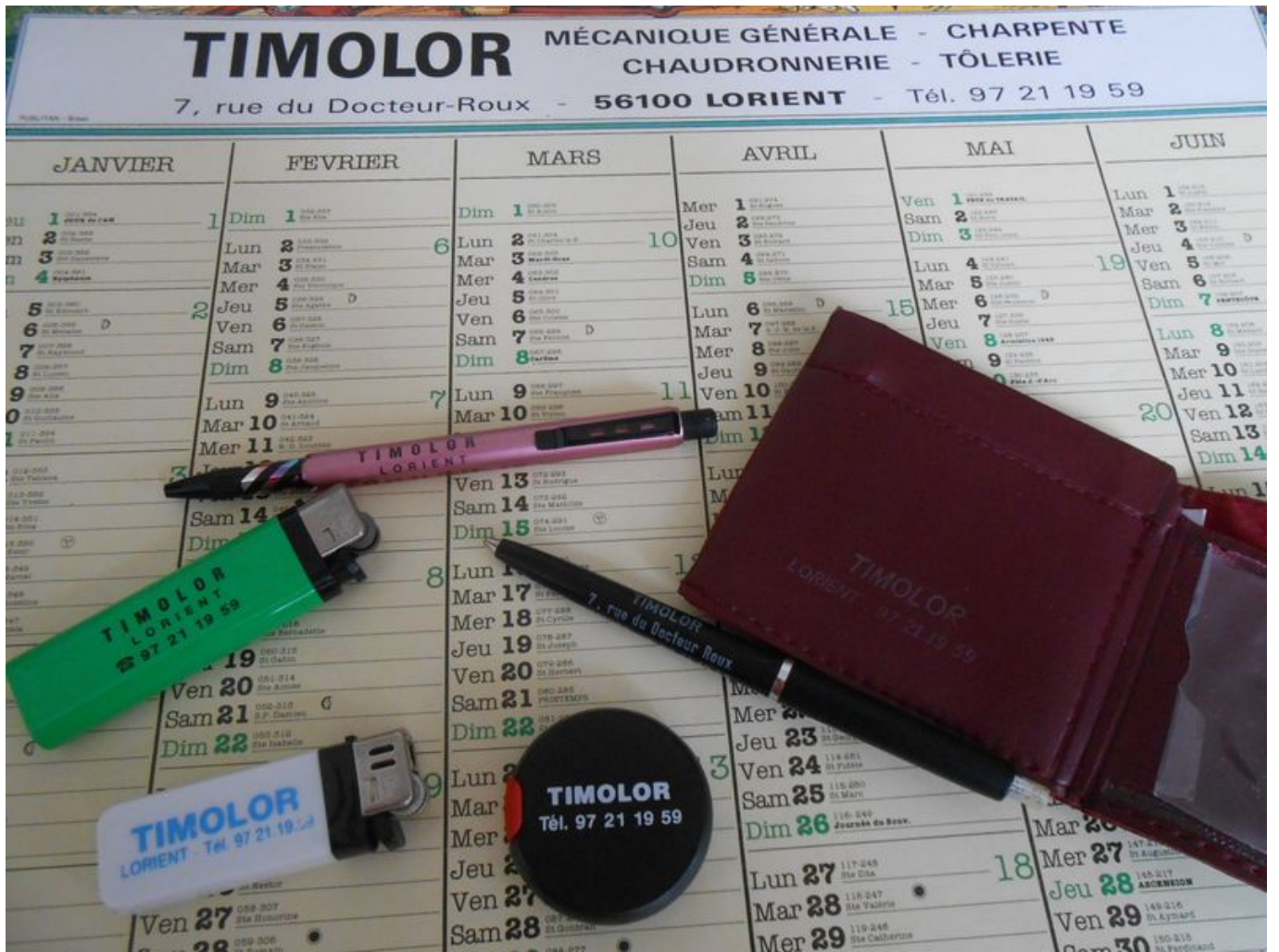
Objets publicitaires au nom de Timolor