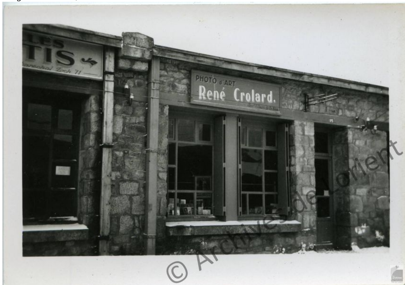
La boutique en baraque.