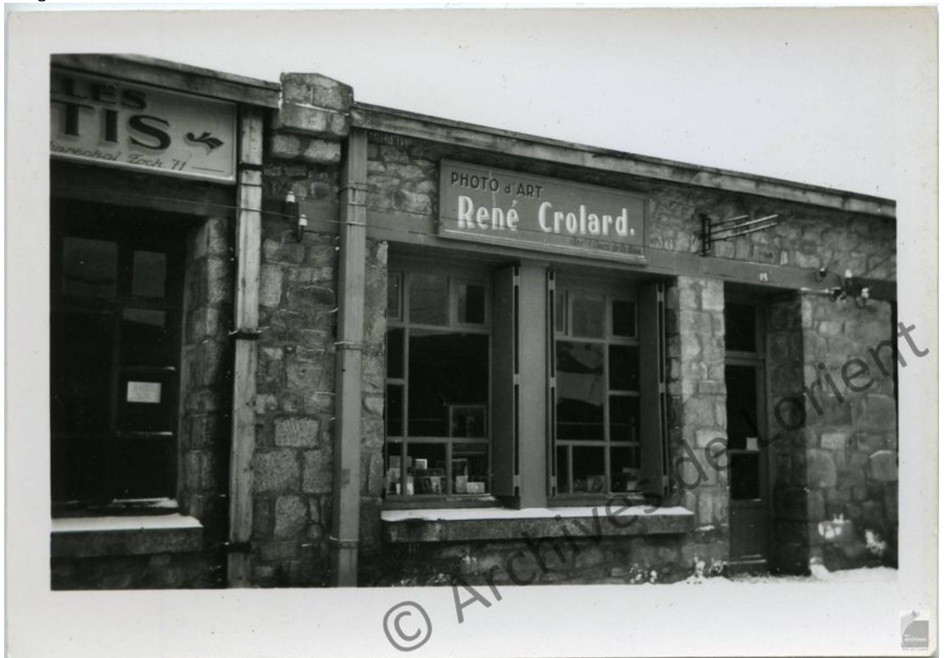
La boutique en baraque.