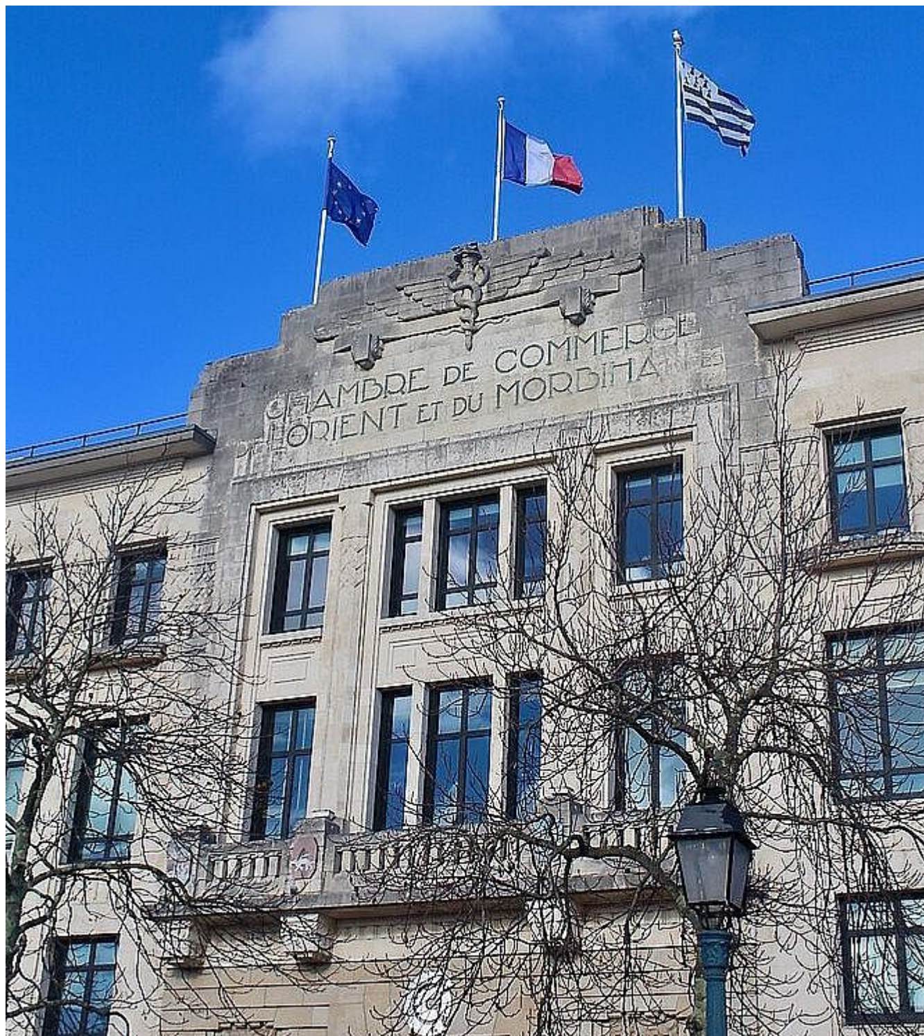
Chambre de commerce et d'industrie de Lorient