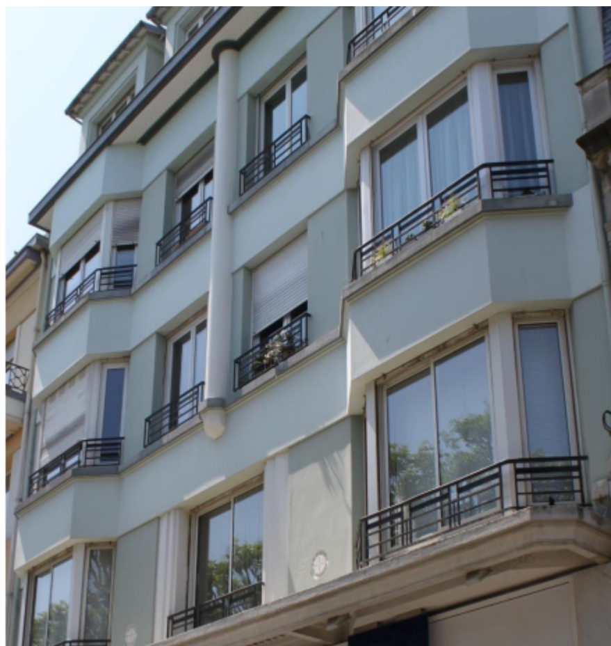
n°29 cours de Chazelles

Une certaine esthétique se dégage de ses réalisations. Il agrandit l'Union Coopérative de Lorient, réalise l'hôtel des Voyageurs de Clohars-Carnoët (actuel hôtel de ville) et la mairie de Quéven.