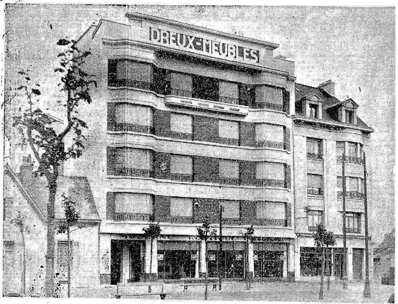
Cours de Chazelles © Le Nouvelliste, 09/10/1937