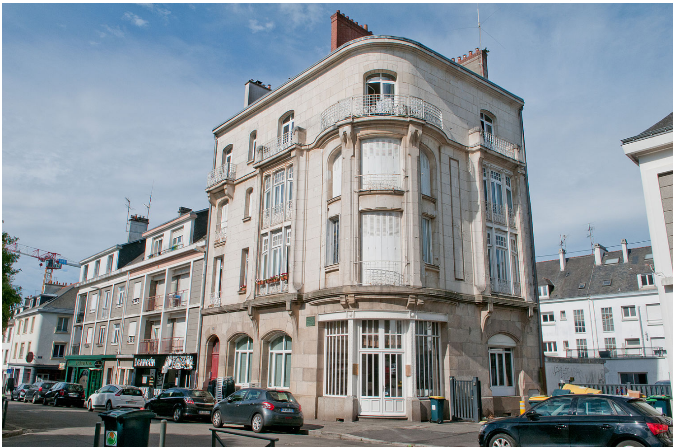
n°22 rue Poissonnière