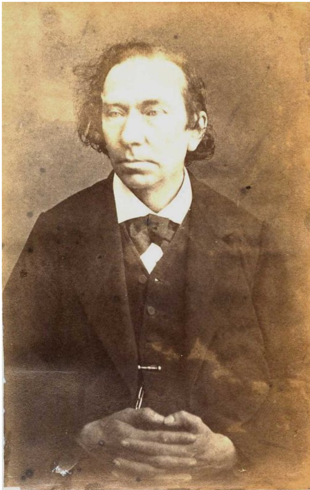
Ernest Hello. 1879. photo reprise par Léon Bloy et Félix Vallotton

Ernest Hello, né le 4 novembre 1828 à Lorient et mort le 14 juillet 1885 à Keroman, près de Lorient, est un écrivain et critique littéraire français, apologiste chrétien.