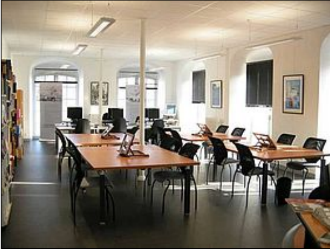
La consultation des permis de construire