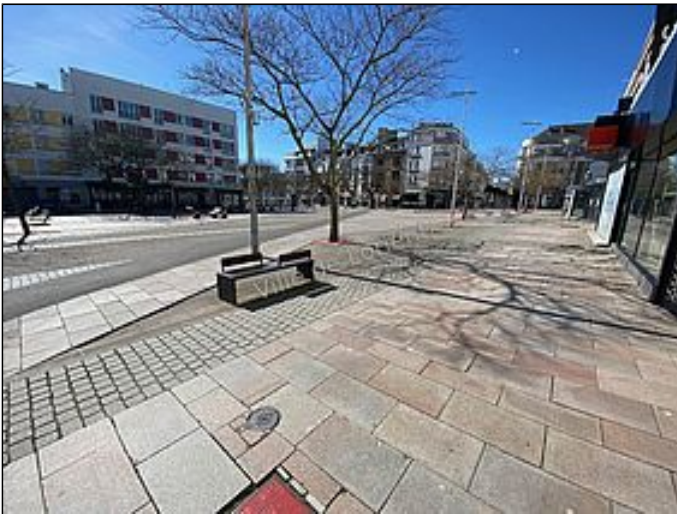
La Mémoire du confinement est en ligne