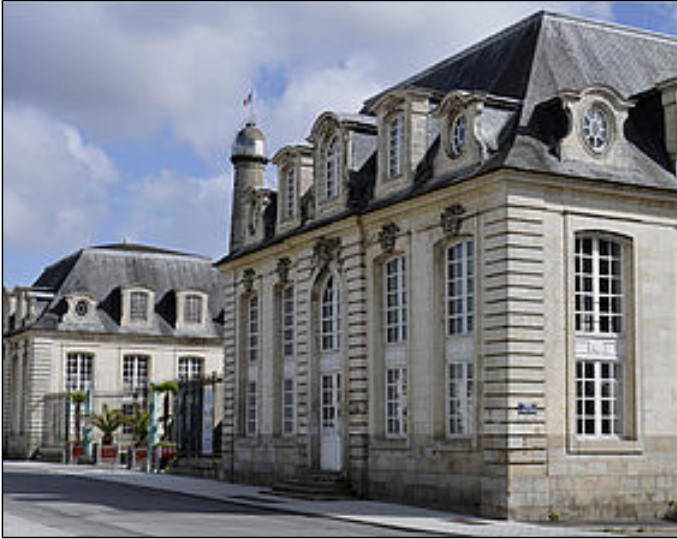
Fermeture annuelle de l'Hôtel Gabriel